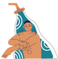
Má higiene íntima