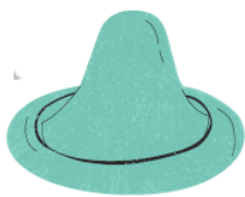
Uso de Preservativo