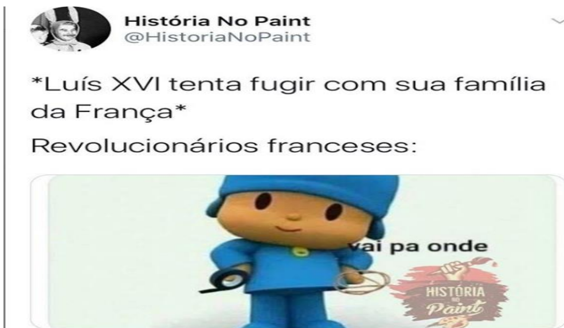
Figura 6: Meme Pocoyo