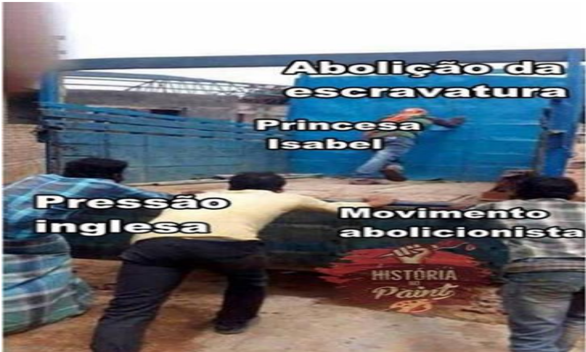
Figura 4: Meme Empurrada do Caminhão