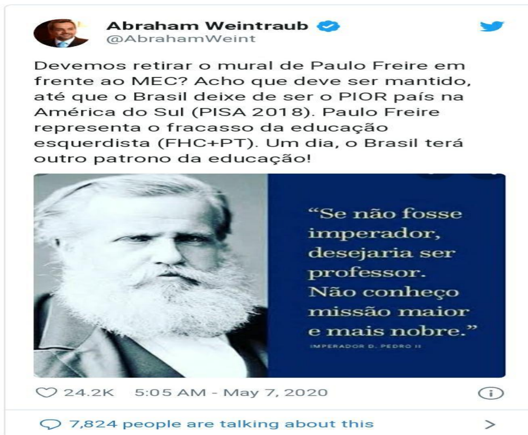
Figura 2: Tweet do Ministro da Educação a respeito de Paulo Freire. 99