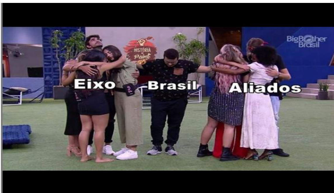
Figura 5: Meme BBB