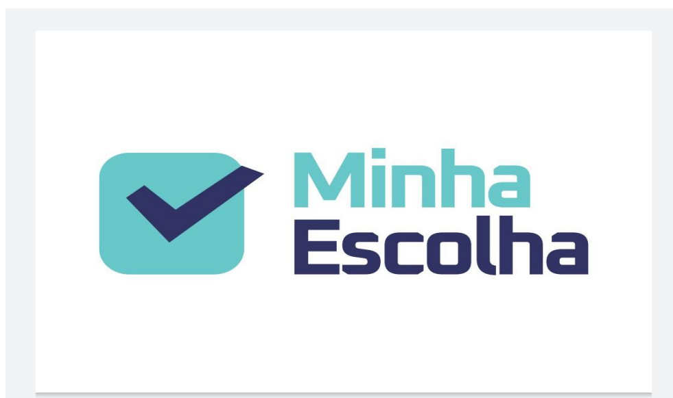
Figura 1 - Imagem de abertura do aplicativo