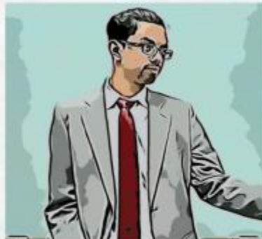
Professor de Geografia - O Paciente