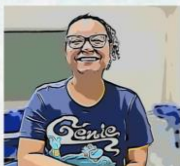
Margô - A Questionadora