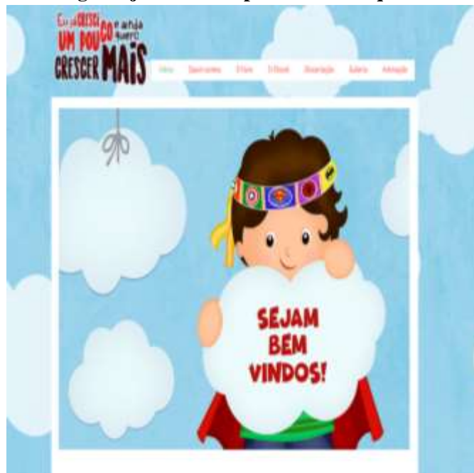
Figura 97: Blog: Eu já cresci um pouco e ainda quero crescer mais