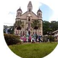
Festa de Arremate

Fonte: https://www.museufoliadereis.com/início