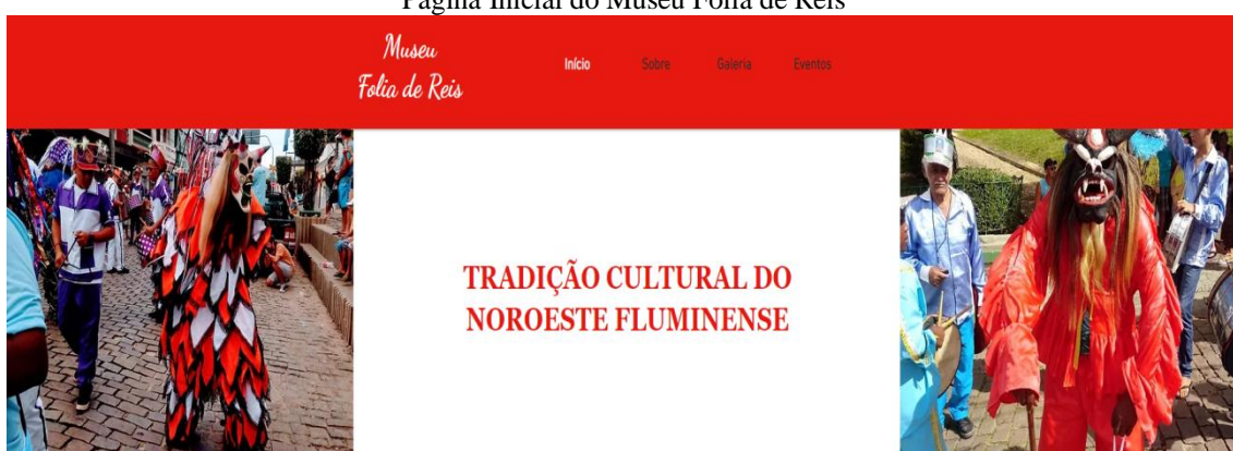
Página Inicial do Museu Folia de Reis