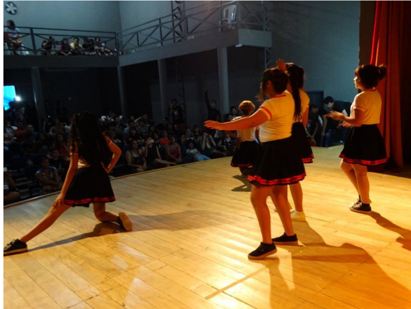
Figura 10: apresentação de dança de um grupo de K-pop durante o Horizonte Geek em 2018.