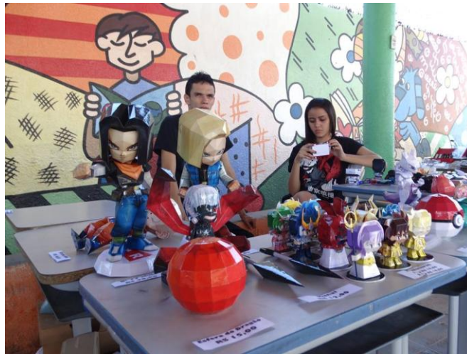
Figura 8: Estande de venda Papercraft no Hora-Con Remake Project em 2016.

outro devem vender para que disputem entre si. Como o resultado, o que se observa é que de fato não há uma competição, mas sim um tabelamento de preços. Os produtos à venda neste tipo de evento possuem preços muito similares. Uma prática adotada por esses comerciantes desde antes da realização do primeiro evento geek em Horizonte, algo que é reproduzido em muitas outras cidades da região metropolitana que abrigam tais aglomerações. Algo que é feito em comum acordo entre os vendedores para que ninguém saia no prejuízo na hora de vender seus produtos.