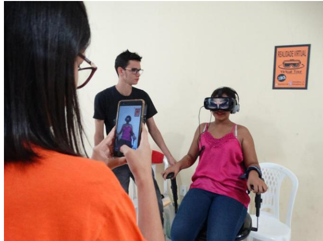
Figura 3: Demonstração da tecnologia de realidade virtual no evento Horizon Geek realizado em 2018.

apenas a interface 10 do jogo. As pessoas que fizeram uso da realidade virtual apresentaram as mais diversas reações, desde medo, susto, até mesmo admiração e euforia. Para além da identificação com a cultura geek, vivenciar algo novo se constitui como um dos elementos atrativos deste tipo evento.