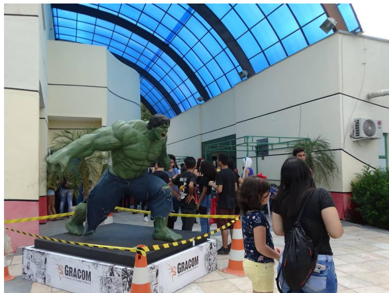
Figura 11: Estatua em tamanho real do personagem Incrível Hulk em exposição no Horizon Geek de 2018.