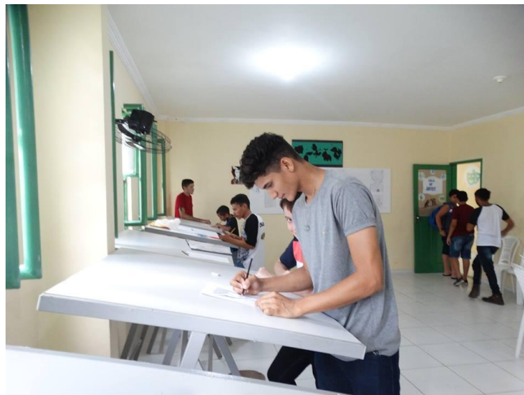
Figura 6: Workshop de desenho realizado no Horizon Geek em 2018.