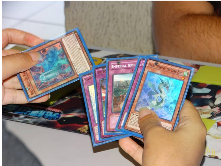
Figura 4: Card Game no evento Hora-Con Remake Project em 2016.

A sala de card games é onde são realizadas as partidas de jogos de cartas e, dependendo da disponibilidade, um mestre para narrar partidas de RPG 12 de mesa também realiza algumas sessões durante o evento. Esta sala conta com um organizador e cerca de dois ou três jovens na ação.