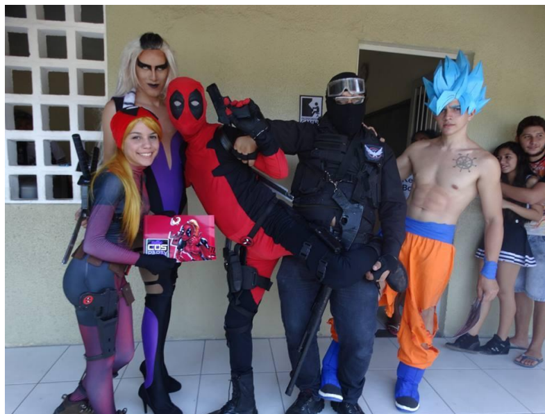
Figura 9: Grupo de praticantes de cosplay que participaram do Hora-Con Remake Project em 2016.

A opção de alguns jovens ao praticar o cosplay 19 está relacionada a uma paixão e identificação estética por determinado personagem. A figura dramática de sua escolha, neste sentido, se constitui como um tipo ideal descrito por Maffesoli (1998, p. 16) como “tipo mítico”, uma existência vazia de sentido que é preenchida pela confluência das emoções coletivas em um significado em comum. Um personagem fictício pode ser visto de diferentes