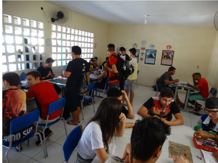
Figura 5: Jogo de RPG de Mesa durante Hora-Con Remake Project em 2016.