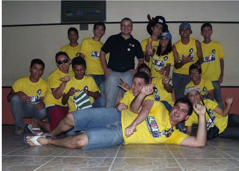
Figura 1: Equipe responsável pela organização do evento HAHA em 2012.