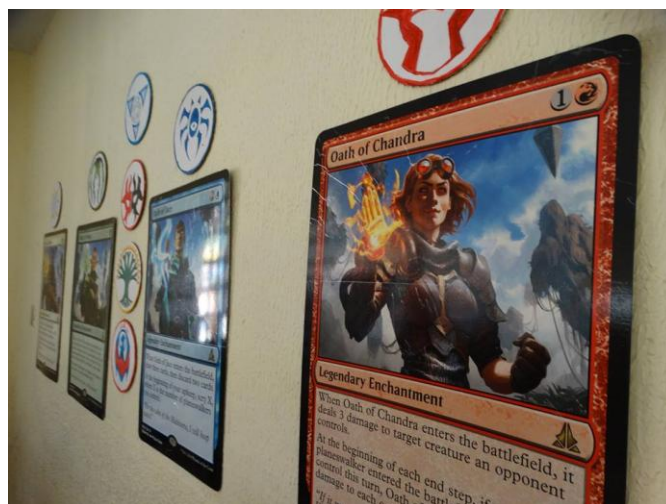
Figura 2: decoração para o evento Hora-Con Remake Project em 2016.