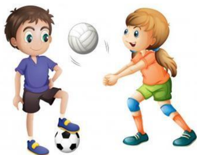
imagem 7

O incentivo à prática de esportes acontece por meio das aulas da disciplina de Educação Física e projetos de treinamento esportivo. O campus também disponibiliza a quadra para jogos internos e uniformes para os times ou competidores individuais. Além disso os discentes podem participar de