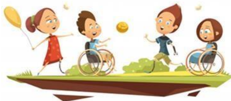
Freepik imagem 8

A instituição conta com a existência do Núcleo de Atendimento às Pessoas com Necessidades Educacionais Específicas (Napne). Esse núcleo,