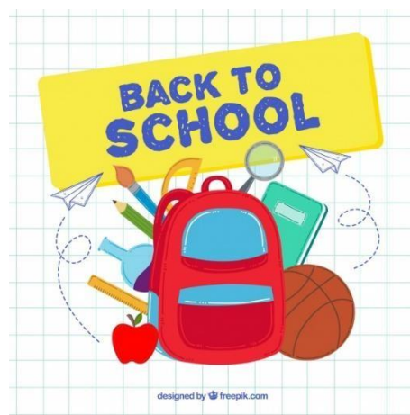
Freepik Imagem 15

Antes do início de cada período letivo o(a) aluno(a) deve realizar a rematrícula em todos os componentes curriculares em que foi aprovado e dependências, quando for o caso. A rematrícula será realizada no prazo estipulado de acordo com o calendário acadêmico a ser divulgado. O abandono de curso caracteriza-se pela não renovação da matrícula dentro dos prazos estipulados no calendário acadêmico.