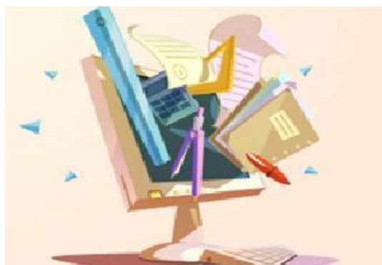
Freepik Imagem 12

A instituição oferece apoio pedagógico aos professores, coordenadores e estudantes por meio do Núcleo de Apoio Pedagógico (NAP) com atenção ao processo de ensino-aprendizagem, orientação e acompanhamento de alunos(as) com baixo rendimento escolar e com dificuldade para organizar os estudos. Esse acompanhamento ocorre ao longo do ano letivo com a realização de reuniões com pais/responsáveis, docentes e gestores, além de reuniões individualizadas com pais/responsáveis agendadas previamente com objetivo de oferecer sugestões para auxílio nas atividades escolares, orientações relativas à escola, vestibulares, Enem e métodos de estudo.