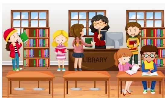
Imagem 18

É necessário fazer a ativação de cadastro de usuário da biblioteca. Os interessados devem procurar o balcão de atendimento na biblioteca munidos de documento de identificação, comprovante de endereço e comprovante de matrícula do semestre vigente.