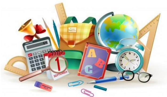
Imagem 21

Ao longo do ano letivo são desenvolvidos diversos projetos relacionados a esporte, cultura e preparação para olimpíadas, como por exemplo Olimpíada Brasileira de Matemática das Escolas Públicas (Obmep), Olimpíada Brasileira de Física das Escolas Públicas (Obfep), Olimpíada Brasileira de Geografia (OBG), entre outras. E ainda projetos de ensino voltados à preparação para o Enem e de atividades culturais.