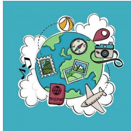
Imagem 22

A Coordenação de Assuntos Internacionais (CAI) do Instituto Federal Goiano (IF Goiano) é o setor responsável, em termos amplos, por gerir a política de cooperação internacional da Instituição. Para tanto, atua basicamente de duas formas distintas. Por um lado, desenvolve um trabalho de identificação e divulgação de oportunidades – cursos, bolsas, obtenção de recursos financeiros, entre outros – oferecidas por instituições nacionais, estrangeiras ou multilaterais. O(a) estudante deve estar atento(a) às publicações dos editais no site institucional.