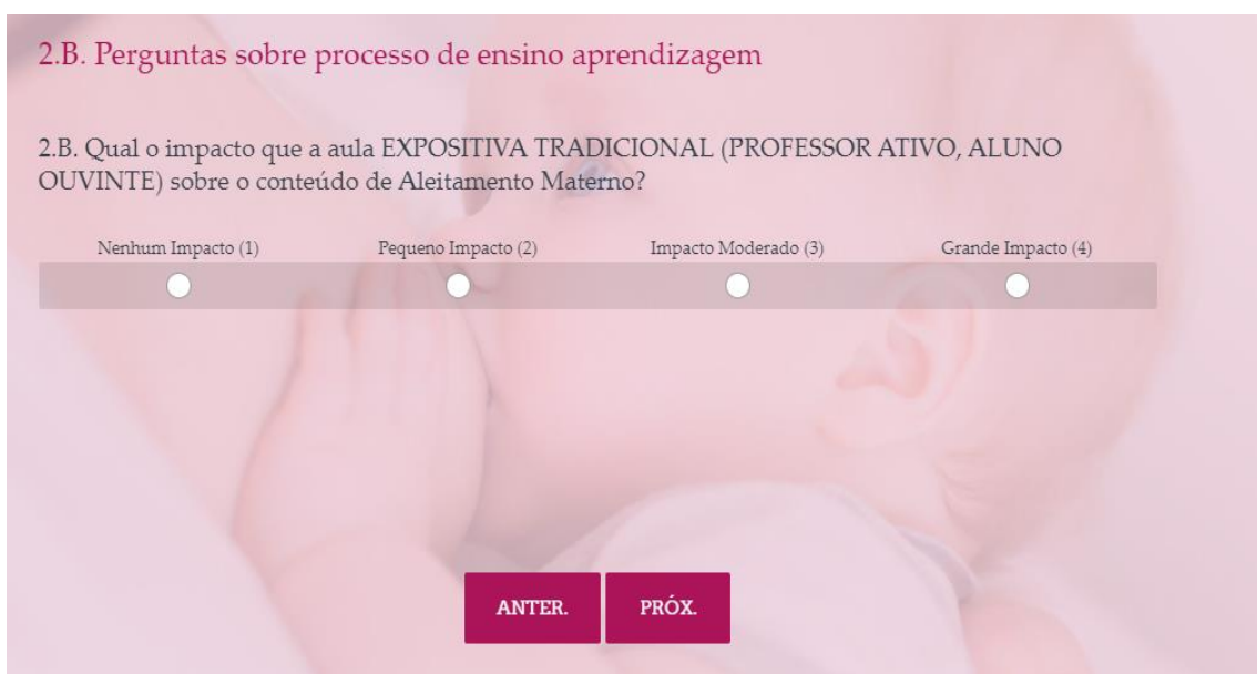
Figura 04 – Questão 2.B do Questionário de Avaliação de Processo de Ensino-Aprendizagem acerca de Aleitamento Materno.