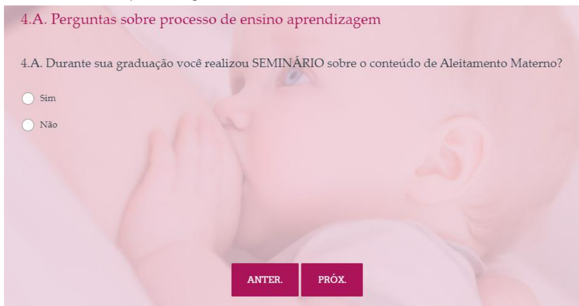
Figura 07 – Questão 4.A do Questionário de Avaliação de Processo de Ensino-Aprendizagem acerca de Aleitamento Materno.