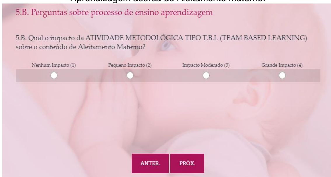
Figura 10 – Questão 5.B do Questionário de Avaliação de Processo de Ensino-Aprendizagem acerca de Aleitamento Materno.