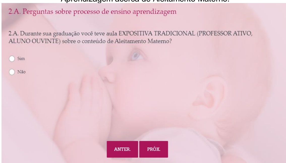
Figura 03 – Questão 2.A do Questionário de Avaliação de Processo de Ensino-Aprendizagem acerca de Aleitamento Materno.