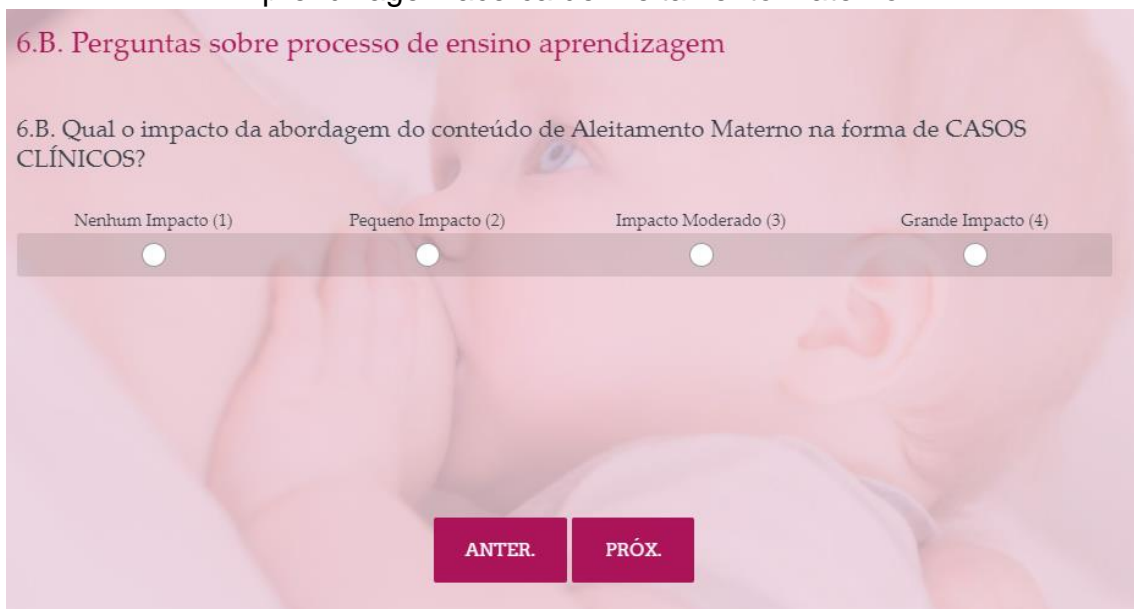
Figura 12 – Questão 6.B do Questionário de Avaliação de Processo de Ensino-Aprendizagem acerca de Aleitamento Materno.