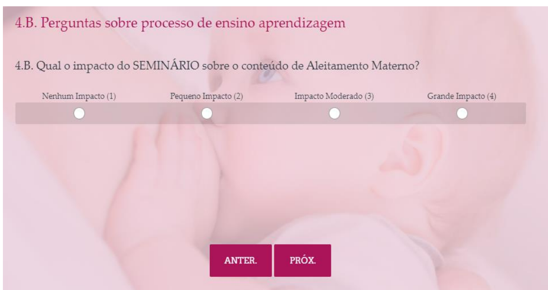
Figura 08 – Questão 4.B do Questionário de Avaliação de Processo de Ensino-Aprendizagem acerca de Aleitamento Materno.