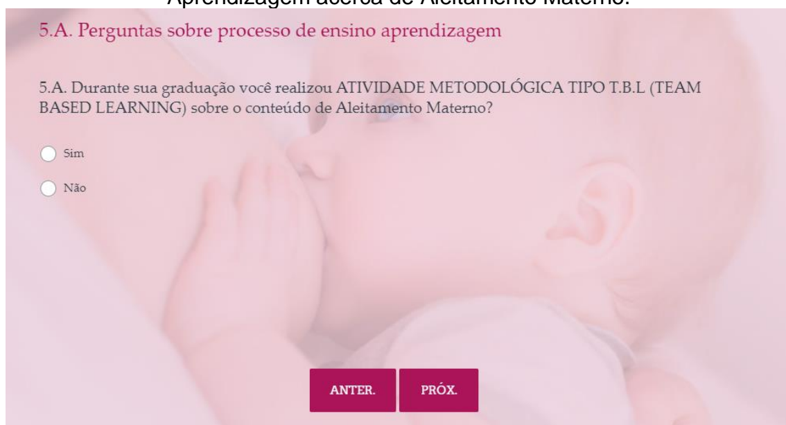
Figura 09 – Questão 5.A do Questionário de Avaliação de Processo de Ensino-Aprendizagem acerca de Aleitamento Materno.