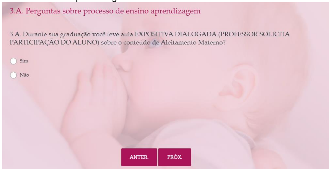
Figura 05 – Questão 3.A do Questionário de Avaliação de Processo de Ensino-Aprendizagem acerca de Aleitamento Materno.