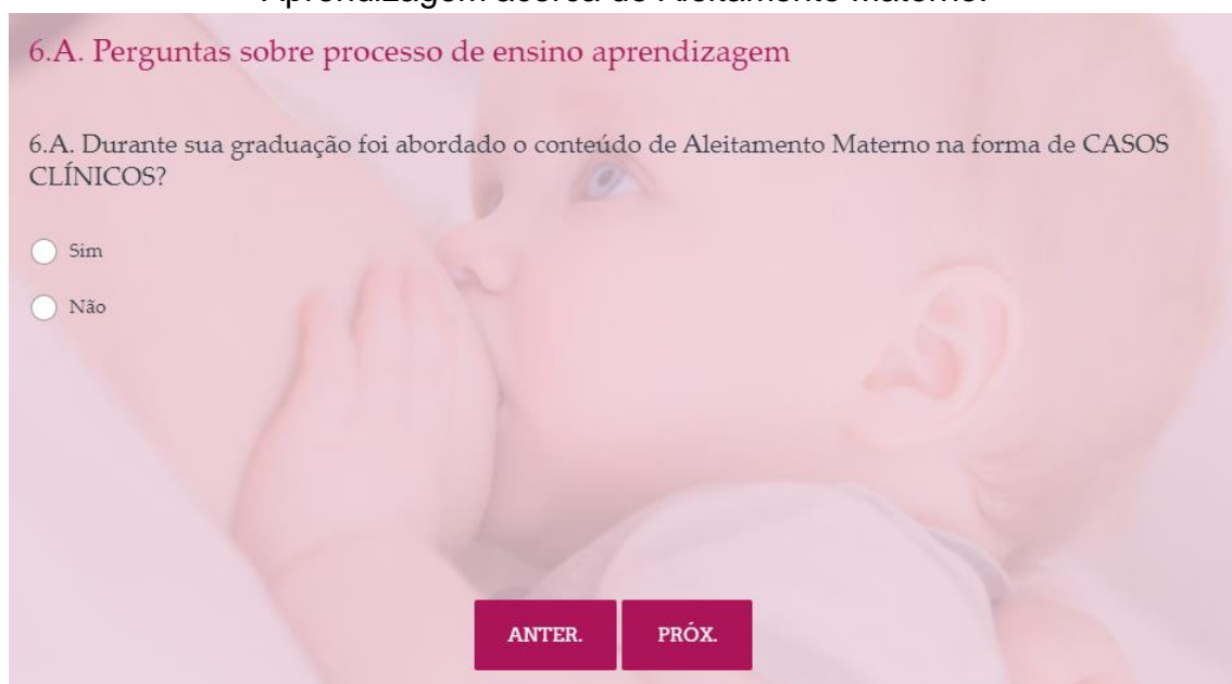
Figura 11 – Questão 6.A do Questionário de Avaliação de Processo de Ensino-Aprendizagem acerca de Aleitamento Materno.