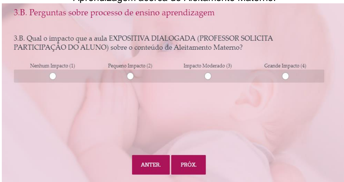
Figura 06 – Questão 3.B do Questionário de Avaliação de Processo de Ensino-Aprendizagem acerca de Aleitamento Materno.