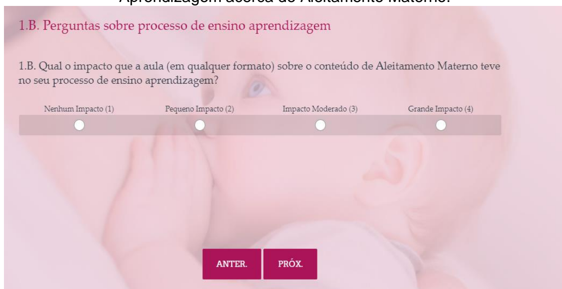
Figura 02 – Questão 1.B do Questionário de Avaliação de Processo de Ensino-Aprendizagem acerca de Aleitamento Materno.