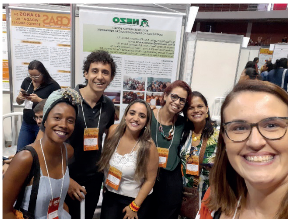
Apresentação de trabalho no congresso brasileiro de assistentes sociais