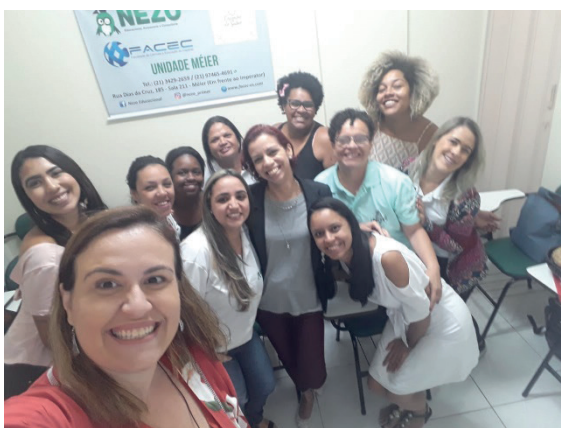
Reunião campo de estágio