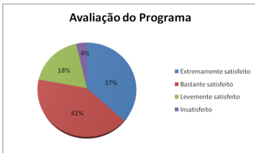
Gráfico 9: Avaliação do Programa do evento Gestão em Foco – Maio 2016

No formulário de avaliação do evento foi possível que os participantes realizassem uma avaliação relacionada ao Programa e ao Instrutor. E os gráficos estão demonstrados abaixo: