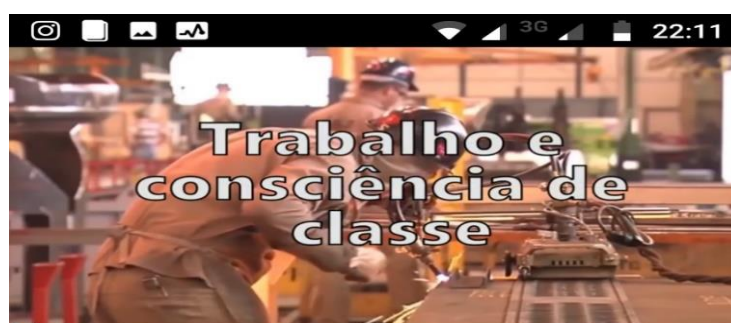
Documentário: Trabalho e consciência de classe

Para essa atividade, vocês deverão assistir ao documentário “Trabalho e consciência de classe” que segue abaixo. Em seguida, deverão produzir memes que trate do assunto tratado no documentário. A postagem dos memes deve ser realizada de acordo com a agenda prevista, para que possamos fazer nossos comentários nas produções dos grupos.