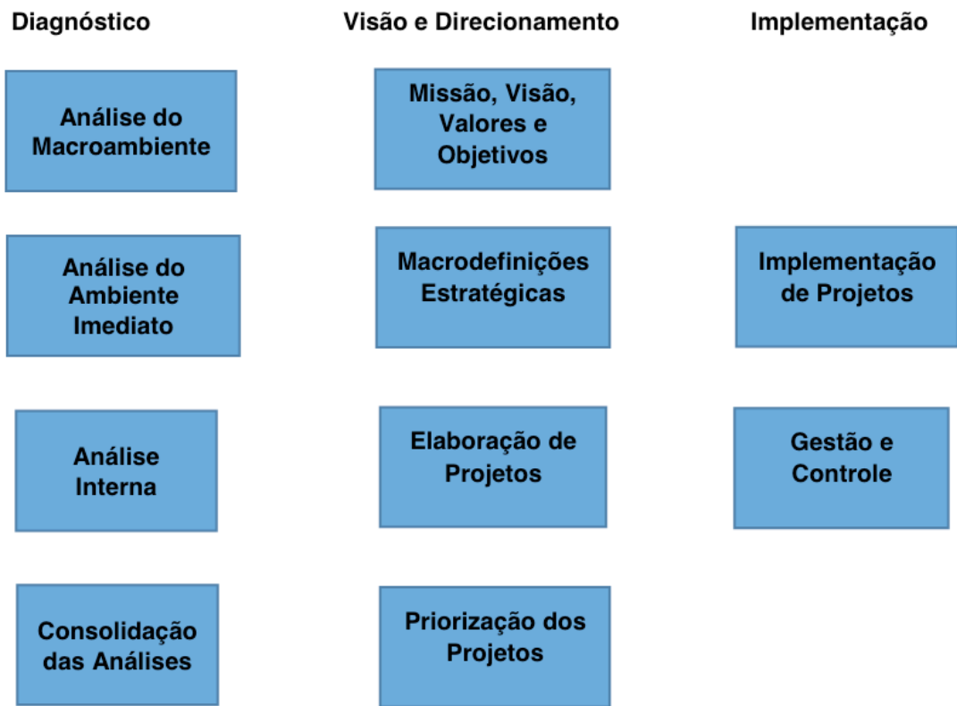
Figura 1: Método Agropformance