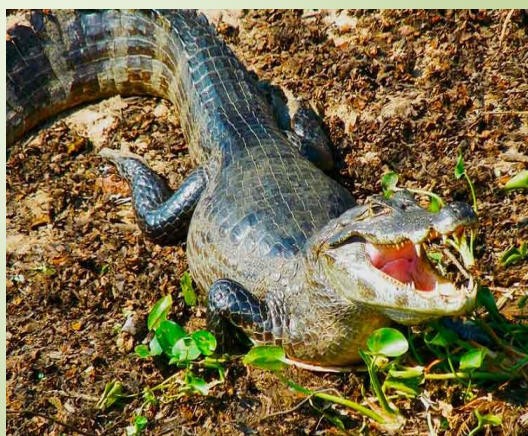
JACARÉ DO PANTANAL

Pertence à classe das aves, e família Psittacidae , sendo o maior representante desse grupo, com cerca de 1 metro da cabeça à cauda, possui coloração azul cobalto, degrade da cabeça a cauda, e amarelo ouro no entorno dos olhos, pálpebras e uma faixa na base da mandíbula.