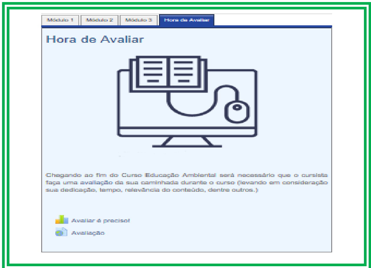
Figura 6: Hora de Avaliar

Chegamos ao fim do CURSO DE FORMAÇÃO EM EDUCAÇÃO AMBIENTAL: UM CAMINHO NECESSÁRIO , momento do participante fazer uma avaliação da sua caminhada durante o curso (levando em consideração sua dedicação, tempo, conteúdo, dentre outros).