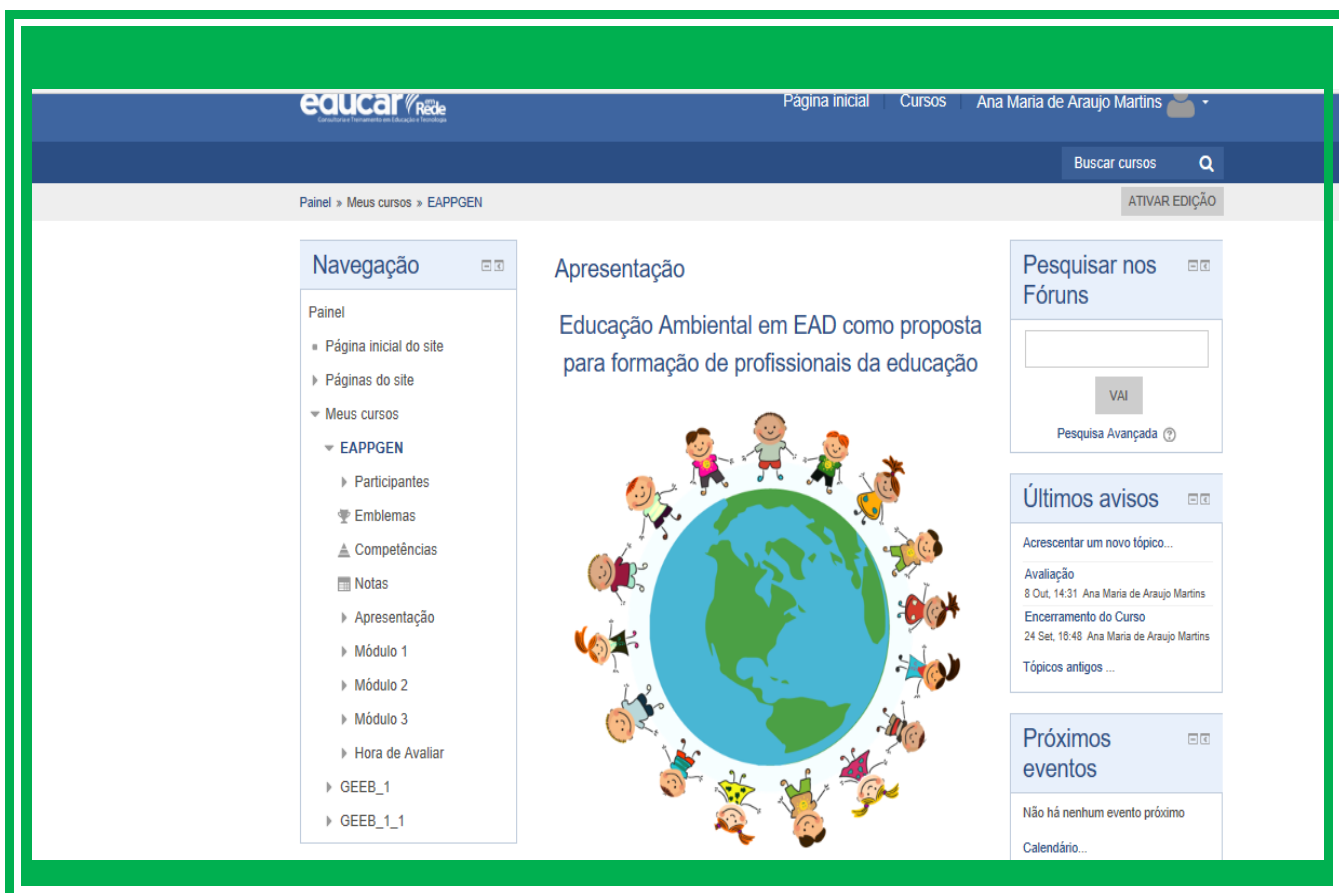
Figura 1: Apresentação: Educação Ambiental em EaD como Proposta para Formação de Profissionais da Educação