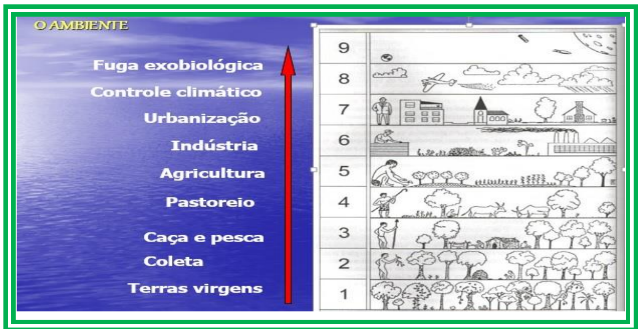
Figura 4: Escala de interferência humana na paisagem de Dansereau (1999, p.192)