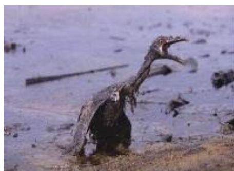
Imagem 1 1

Com relação ao Movimento Feminista, este é ilustrado com a foto da capa da partitura do hino “A Marcha das Mulheres” (idem), fazendo referência à luta pelos votos (ver Imagem 2, abaixo). Mesmo considerando que o espaço dedicado a cada tema é pequeno, diante da complexidade que a própria literatura sociológica abrange, o assunto é tratado historicamente