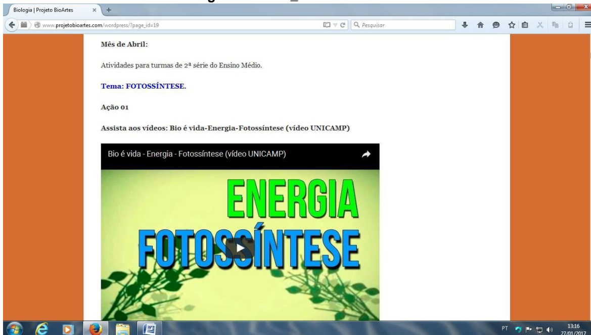
Figura 8: Vídeo_ Fotossíntese

Fonte: Vídeo disponível em: http://www.embriao.ib.unicamp.br/embr