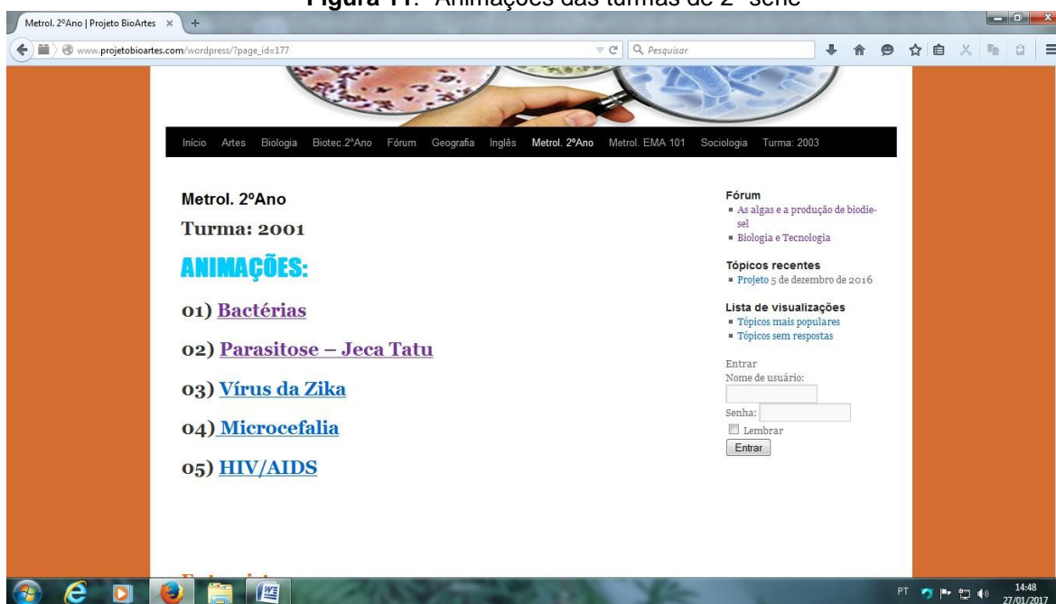
Figura 11:- Animações das turmas de 2ª série