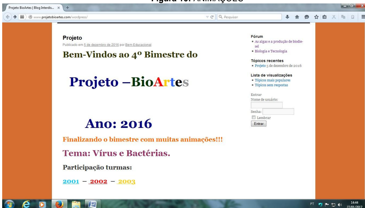
Figura 10: ANIMAÇÕES