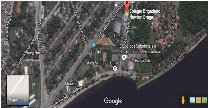
Figura 1: Praia de São Bento localizada no bairro do Galeão