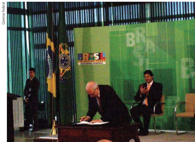
O Presidente da República em exercício, José Alencar, assina Lei que inclui a Filosofia e a Sociologia em todas as séries do Ensino Médio. (2 de junho de 2008)

No dia 2 de junho de 2008, o Presidente da República em exercício, José Alencar, sancionando a Lei nº 11.684 que incluiu a Filosofia e a Sociologia como disciplinas obrigatórias em todas as séries do Ensino Médio. Se não há uma lei com mesmo teor e clareza em relação à Biologia, Química, Física, Geografia, História, por que uma Lei para a Sociologia?