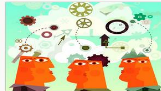
Desenvolvimento de Ideias Inovadoras para Novas Empresas: O Primeiro Pas... UMD • Ago 18º Legendas disponíveis em Português