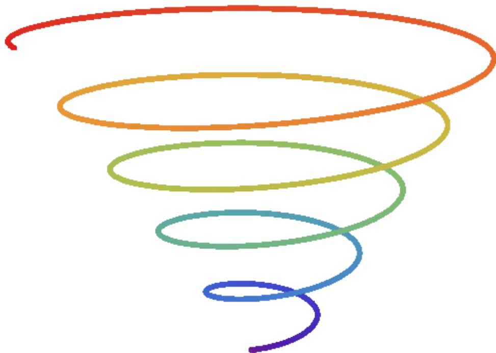
Figura 1. Representação dos ciclos da pesquisa-ação em espiral ascendente ou de aperfeiçoamento da educação.