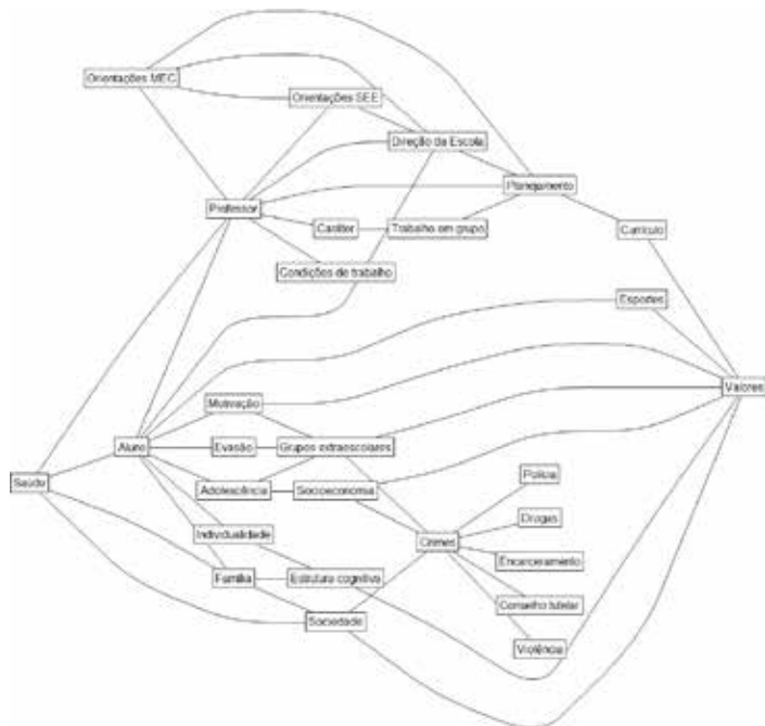
Figura 2. Esquema simplificado da educação como sistema complexo. Os retângulos representam unidades (também complexas) e as linhas representam interdependências.

As relações entre unidades constituem interdependências. Não existem unidades isoladas ou imunes a influências. Elas podem ser benéficas ou perniciosas. Uma influência de aparência insignificante pode ter uma repercussão muito expressiva. Quando perniciosas, chega a ser uma vulnerabilidade, um risco para o sistema educacional.