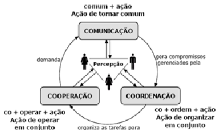
Figura 2: Esquema de Colaboração (Fuks et al. : 2005, p. 20)

A representação do esquema da colaboração, proposto pelos autores, permite a percepção da complexidade do trabalho a ser feito em cursos online tendo-se o fórum de discussão como espaço de interação com finalidade pedagógica. É interessante observar, no esquema de Fuks et al. (2005, p. 20), a maneira como demonstram ver o que chamam de coordenação : uma atividade conjunta, e não atribuída somente ao professor. Trata-se de uma visão que parte do princípio de que todas as atividades envolvidas são desempenhadas pelo grupo, e não atribuídas ou monopolizadas por um ou outro participante.