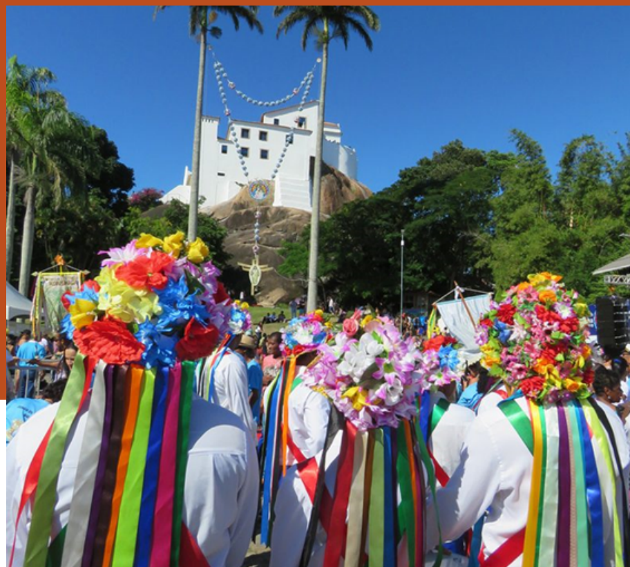
Fonte: < https://franciscanos.org.br/noticias/congo-a-marca-da-alegria-da-festa-da-penha.html#gsc.tab=0 >

Nessa imagem temos um grupo de Congo se aproximando para uma apresentação durante a Festa da Penha que ocorre em Vila Velha-ES. Como você explicaria esse evento a um turista?