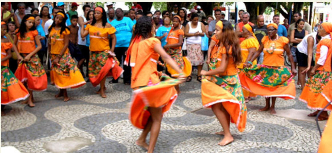
Roda de Jongo-Caxambu

Ritual de origem Bantu, o nome Jongo se refere às cantigas e pontos entoadas durante o ritual e o nome Caxambu refere-se ao tambor utilizado pelos jongueiros, assim dá-se o nome de rodas de Jongo ou rodas de Caxambu. O ritual acontece em um círculo em sentido anti-horário ao som de tambor, ganzá ou reco-reco, manifestação de entidades religiosas africanas, os jongueiros dançam e cantam "de forma poética e desafiadora às diversas situações sociais vividas pelas comunidades" (MACIEL, 2016, p.204).