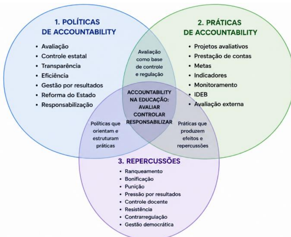
Figura 1 – Accountability na educação