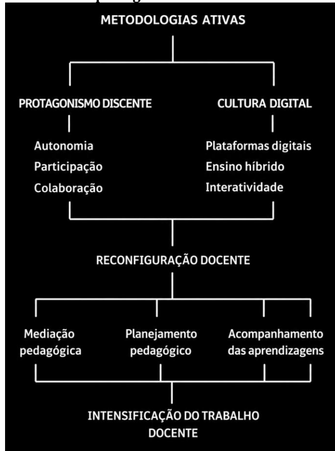
Figura 1 - Entre o protagonismo docente e a cultura digital