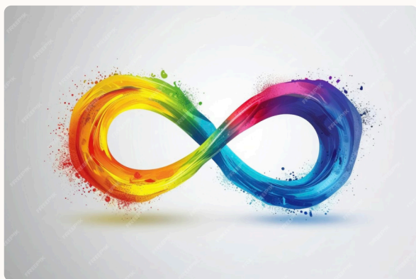
Imagem: Símbolo do Infinito nas cores do arco-íris que se misturam sem delimitação definida representando a amplitude do espectro autista.

As exigências sociais se tornam mais complexas na adolescência, e a consciência das diferenças em relação aos pares pode se intensificar, potencialmente levando a sentimentos de isolamento e baixa autoestima. Por outro lado, muitos adolescentes com TEA desenvolvem interesses específicos que podem se tornar pontos de conexão com colegas e oportunidades para o desenvolvimento de habilidades especializadas.