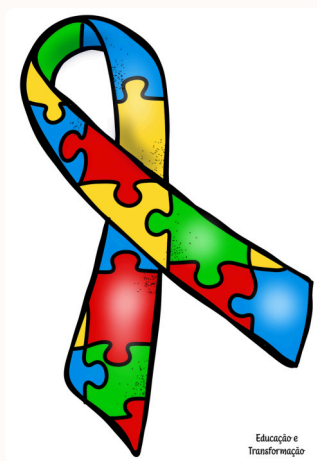
Imagem: Fita símbolo do Autismo, em forma de laço com desenho de peças de quebra cabeça colorido.