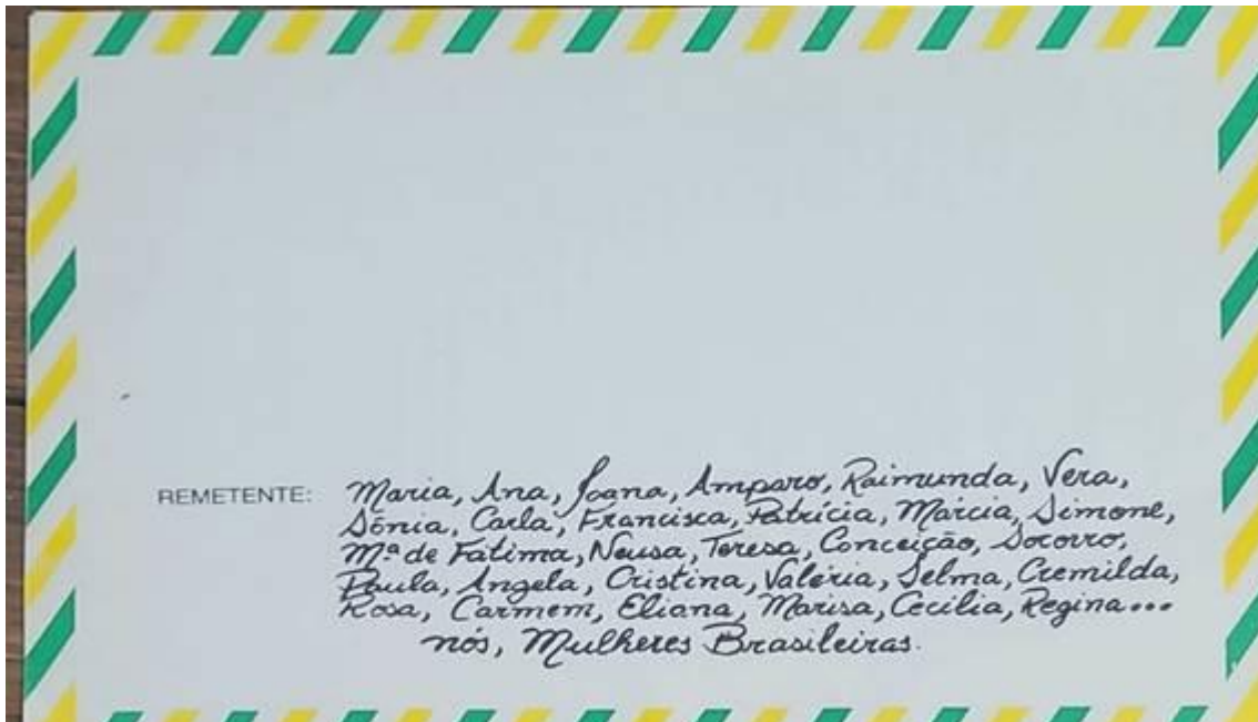
Figura 2. Remetente da Carta das Mulheres aos constituintes