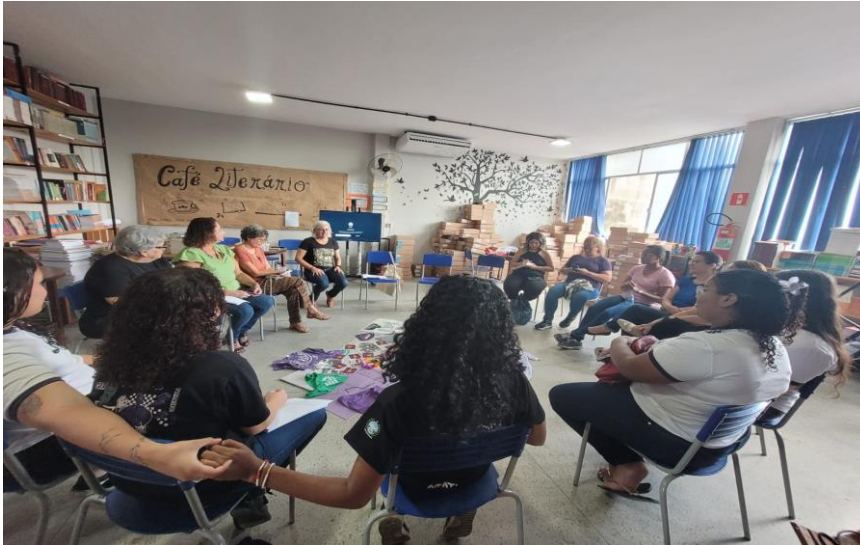
Figura 12. Terceira Roda de conversa.