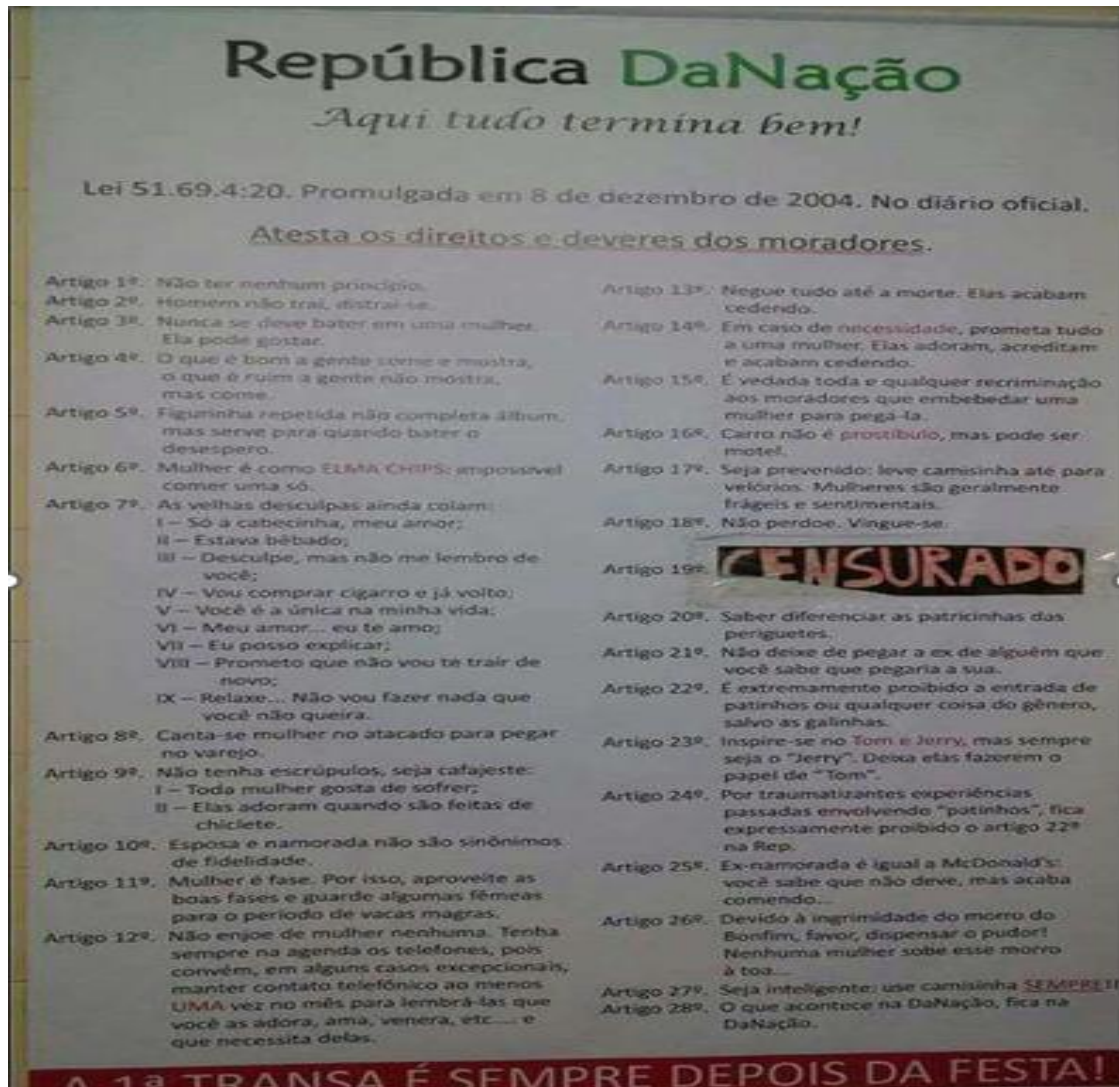
Figura 10. Cartaz fixado em uma república estudantil, Universidade Federal de São João del-Rei 21

de partida para ampliar a discussão sobre o machismo cotidiano e as formas simbólicas e institucionais de violência.