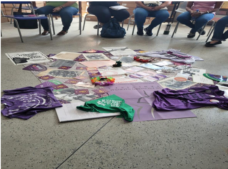
Figura 11. Terceira Roda de Conversa - no centro, exposição de fontes documentais do movimento de mulheres de Nova Iguaçu.

A exposição desses documentos desempenha um papel fundamental ao trazer tais memórias para o espaço escolar, permitindo que as novas gerações conheçam e reconheçam o impacto desses movimentos na sociedade. Sem um esforço contínuo de resgate e compartilhamento, essas memórias tendem a permanecer restritas a arquivos pessoais de acesso limitado ou à lembrança de poucas pessoas que participaram ativamente dessas lutas.