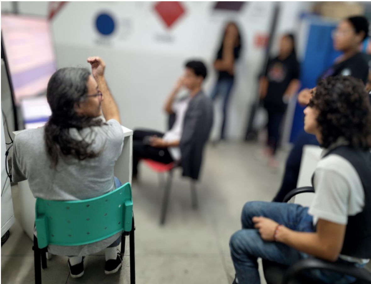
Figura 13. Primeira oficina de podcast.

Metodologia: As oficinas de podcast voltadas para as(os) alunas(os) do CEEAL buscam garantir que todas(os) estudantes se envolvam ativamente em todas as etapas do processo, desde a escolha do tema até a produção de roteiros, gravação, edição e publicação do conteúdo. A programação prevê a realização de três oficinas de 2 horas cada, totalizando 6 horas de atividade. Ao final de cada encontro, uma tarefa será proposta para ser desenvolvida até a oficina seguinte