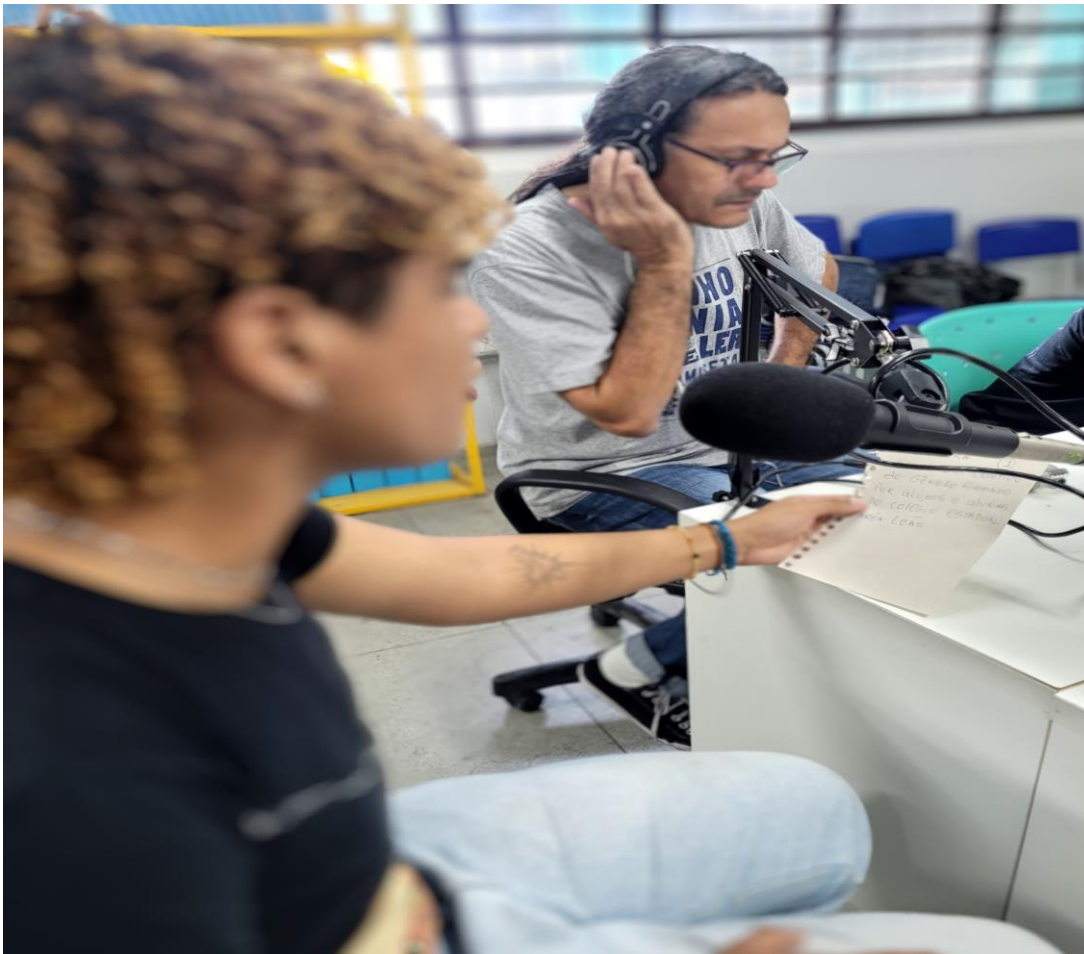
Figura 14. Segunda oficina de podcast.