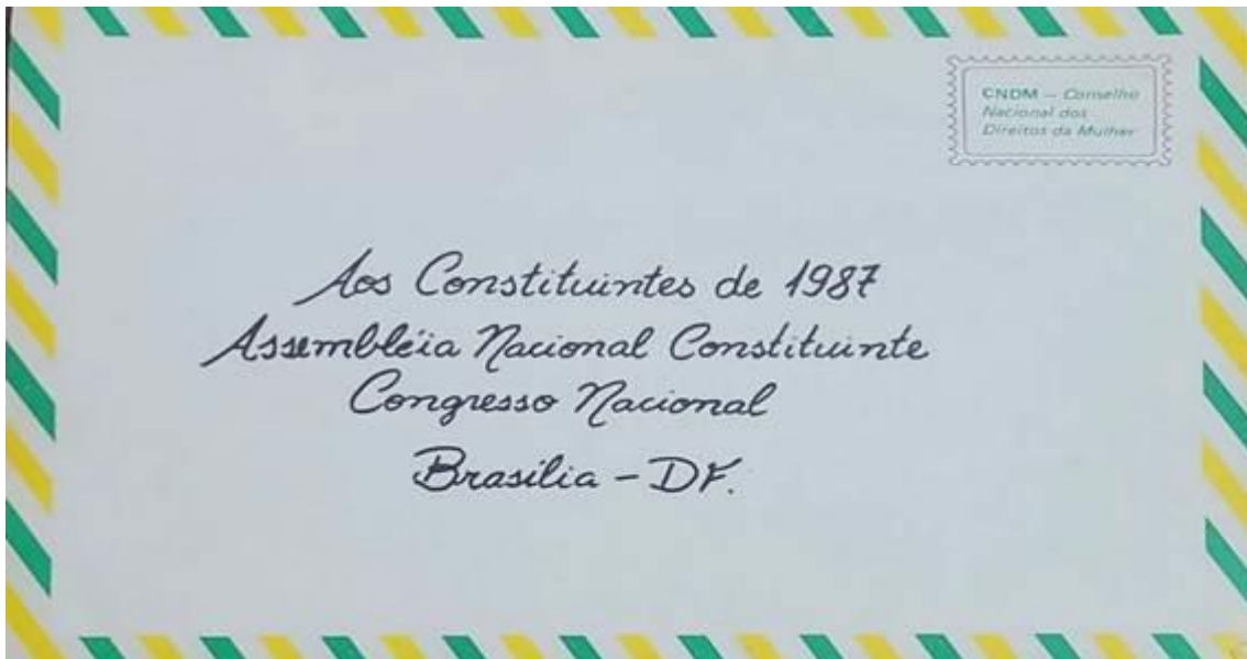
Figura 1. Destinatário da Carta das Mulheres aos constituintes