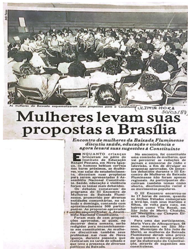
Figura 3. Matéria do Jornal Última Hora - 30/03/1987

Segundo as feministas entrevistadas para esta pesquisa, havia sido realizado um trabalho árduo para realização do encontro, cabe lembrar que a Comissão organizadora era composta por mulheres moradoras dos bairros periféricos, trabalhadoras e estudantes que usavam o tempo livre para militância. Com pouca estrutura de comunicação, a maior tecnologia era telefone fixo, fax e correio, talvez por este motivo, a surpresa em relação ao quantitativo de mulheres presentes no encontro. Além da alimentação, foi organizada uma creche para que todas pudessem participar.