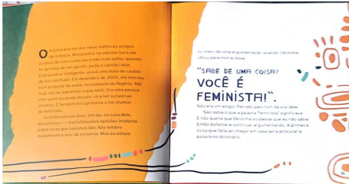
Figura 7. Trecho que a aluna Ju escolheu do Livro Chimamanda Ngozi Adichie - Sejamos Todas Feministas. p.11