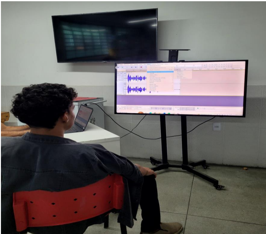
Figura 15. Terceira oficina de podcast.