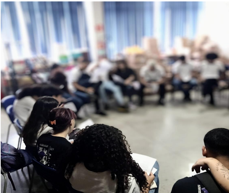
Figura 9. Segunda Roda de Conversa.

Quando foi proposta a leitura das frases, alguns estudantes comentaram que, entre eles, essas expressões costumam soar engraçadas. No entanto, ao serem ditas em voz alta, em um espaço onde o “ papo era sério ”, muitos relataram ter sentido vergonha.