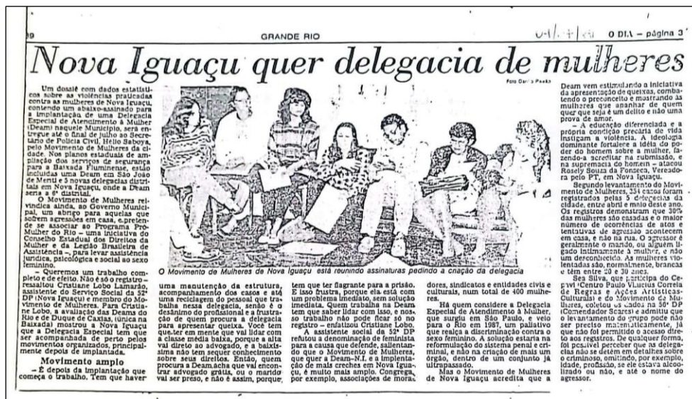
Figura 6. Matéria do Jornal O Dia. 04/07/1989

as cinco delegacias comuns ou delegacias distritais, olhando folha por folha de registros de ocorrência dos últimos três meses, tendo sempre um detetive ao nosso lado, como forma de intimidação. Além dessa comissão, também havia as que mantinham reunião com o prefeito para obter a seção de terreno para construção, convencer diversos vereadores e outras autoridades a escreverem cartas de apoio. Foram dias colhendo assinaturas da população no calçadão comercial de Nova Iguaçu para uma abaixo-assinado. Ao final, foi montado um dossiê e com o apoio da Deputada Estadual, Jandira Feghali, entregamos ao Secretário de Polícia Civil, o documento.