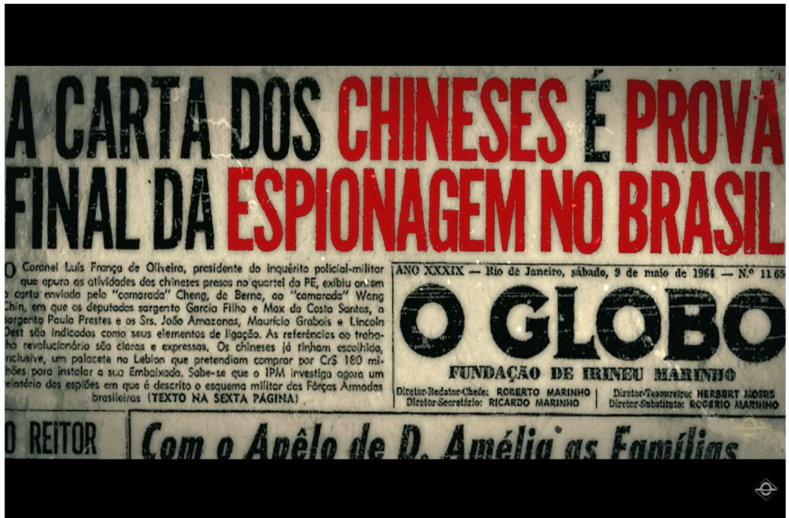
Figura 2: Frame do documentário Brasil Paralelo exibido em sala