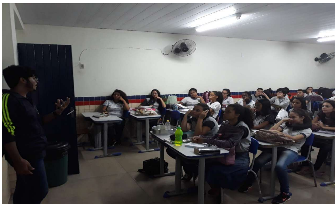
Figura 8: Apresentação final: grupo expondo podcast produzido sobre memórias familiares da ditadura