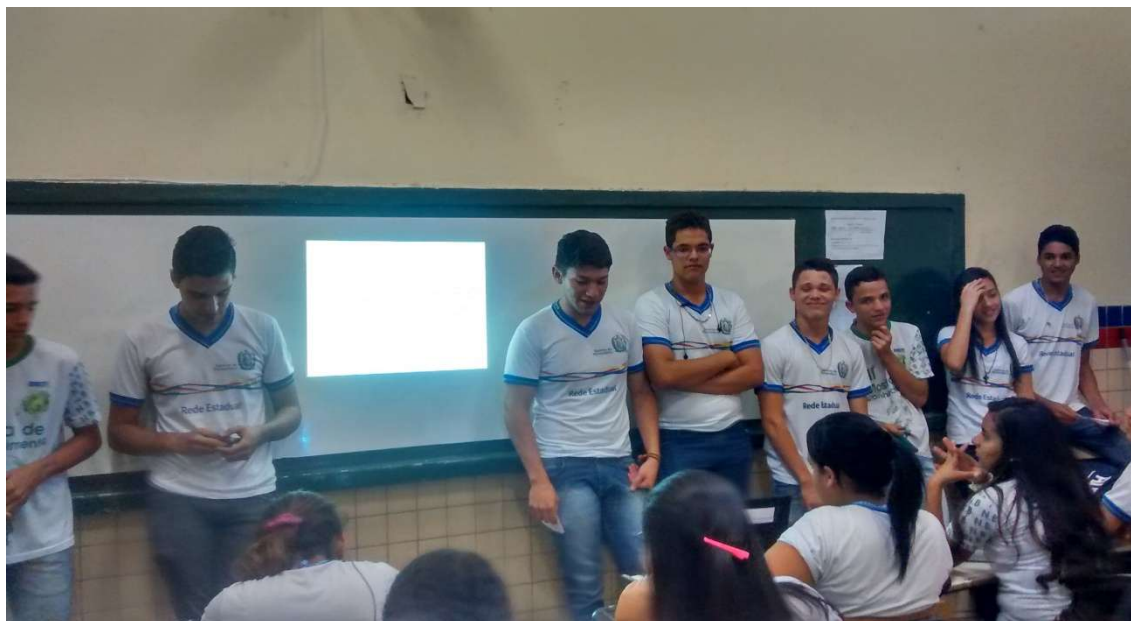
Figura 7: Alunos produzindo vídeo de fact-checking em sala