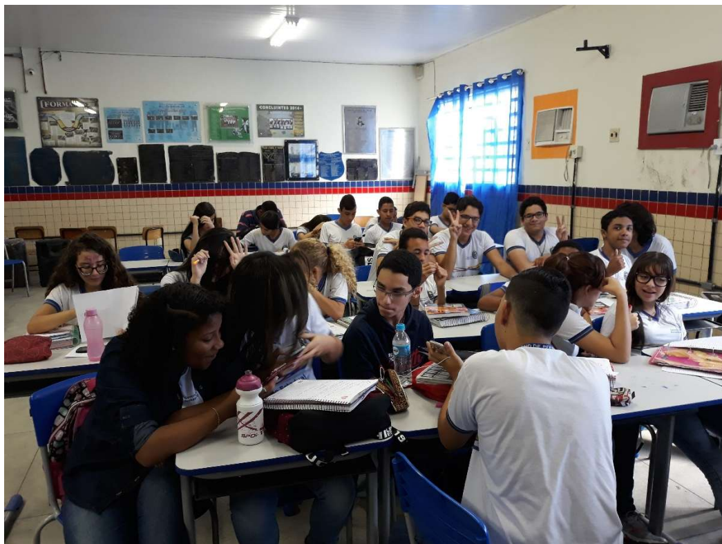
Figura 3: Alunos praticando leitura lateral em smartphones