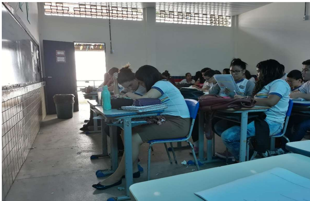
Figura 5: Grupos trabalhando nas fichas de desconstrução