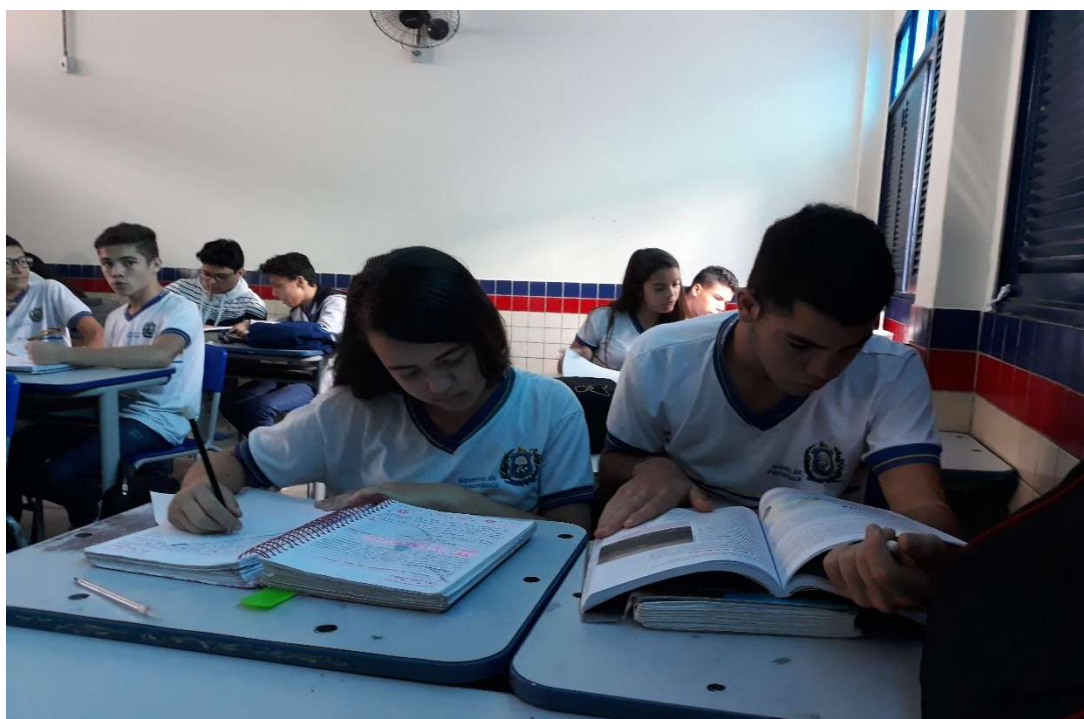
Figura 6: Alunos analisando estratégias retóricas do Brasil Paralelo