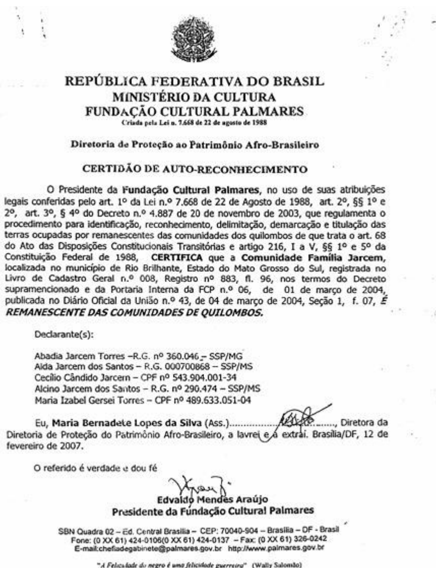
Imagem 01. Certidão de auto-reconhecimento da Comunidade Quilombola Família Jarcem como remanescente das comunidades de quilombos.

Em 2007, a comunidade obteve a certificação oficial da Fundação Cultural Palmares, reforçando sua identidade quilombola através da autoidentificação e da ancestralidade comum. Esta certificação representa não apenas um reconhecimento jurídico, mas também um ato político de afirmação frente a um histórico de deslocamentos forçados, violência simbólica e resistência à perda do território.