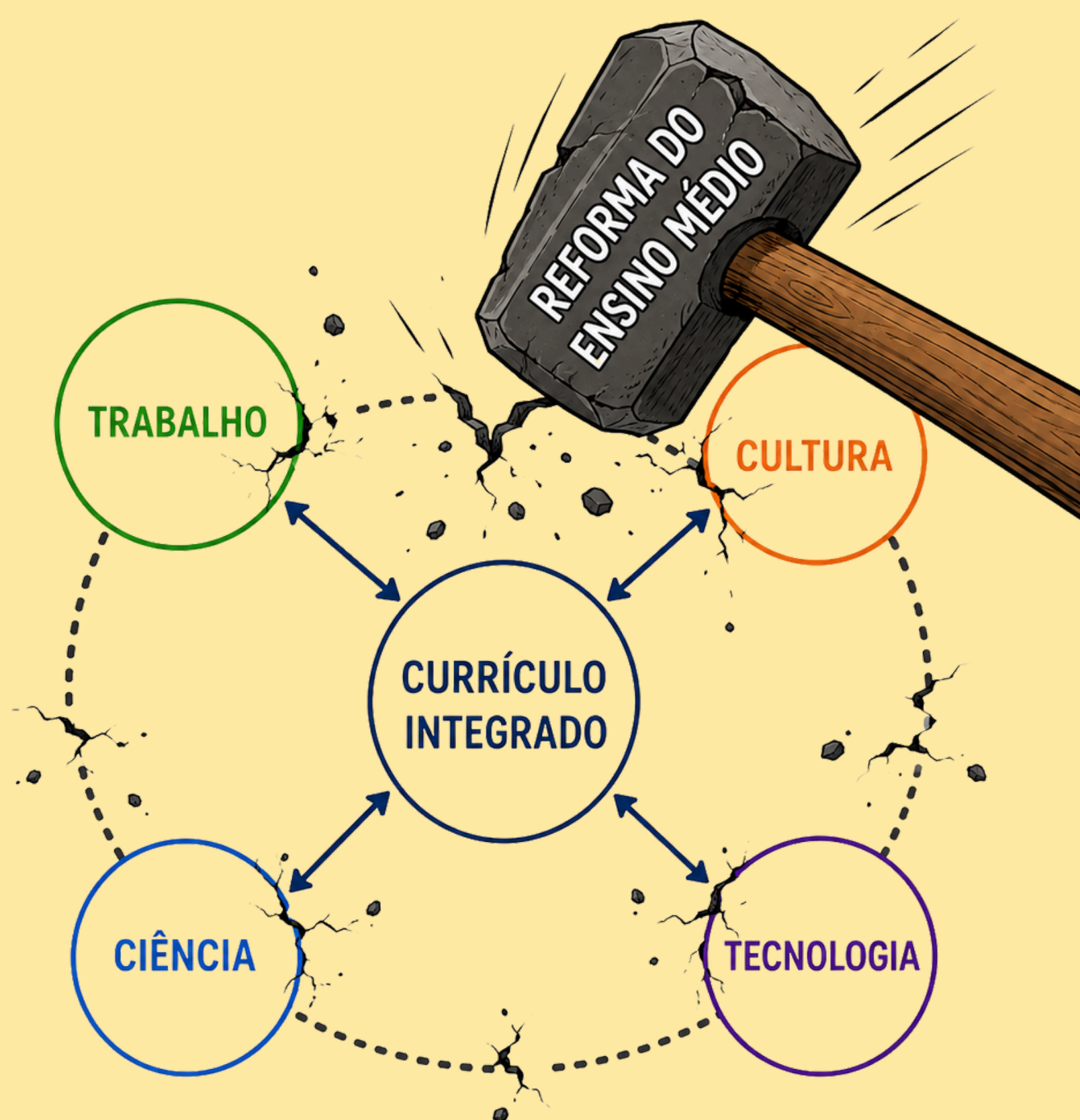
Imagem produzida por ChatGPT- OpenAI

Cada participante registrou, na caderneta, aquilo que considerou mais representativo a partir dos diálogos desenvolvidos.