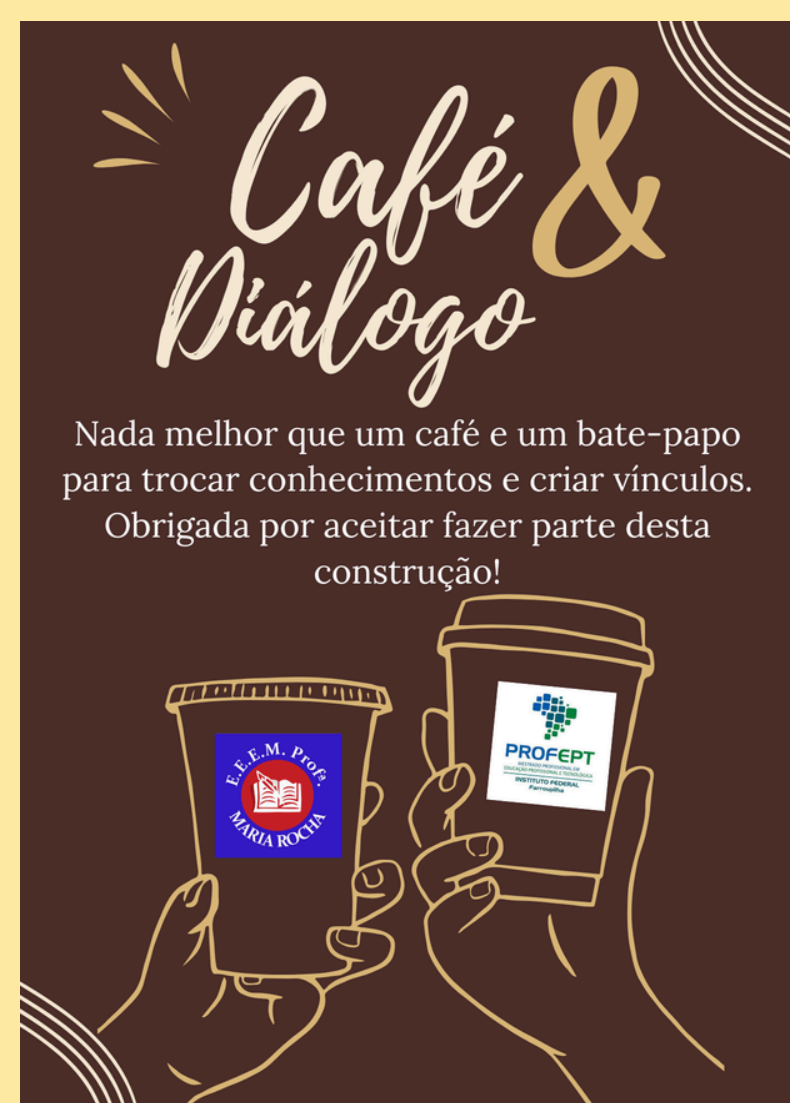
Reprodução da lembrancinha distribuída aos participantes do primeiro círculo.

O café, no intervalo do recreio escolar, costuma ser o momento de confraternização entre os professores. O cafezinho, o biscoito, a conversa descontraída e o riso solto do momento congregam e criam vínculos na sala dos professores. Ao convidar para o café, a ideia foi expressar que os círculos seriam um momento de troca e conversa entre colegas que constroem o dia a dia da escola.