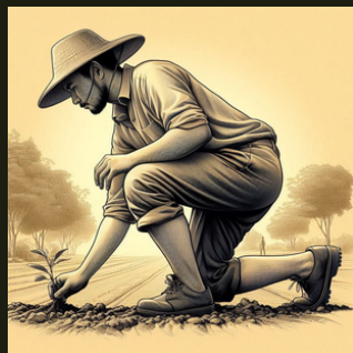
Figura 1: Trabalhador rural realizando colheita.

Oriente o usuário que o risco de lesões musculoesqueléticas aumenta quando posturas de trabalho são mantidas por tempo prolongado e sem alternância 10 . Durante as atividades que exigem agachamento, como plantio e colheita, a posição de cócoras pode ser funcional e segura se utilizada por curtos períodos de tempo, com atenção ao alinhamento corporal (figura 1) 8 9 .