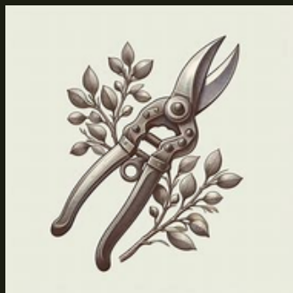
Figura 4: Ferramenta utilizada para poda.

A ferramenta utilizada deve estar amolada e adequada. O uso de “ferramentas mais velhas” pode levar a dores em mãos, punhos, cotovelos e ombros (figura 4) 11 .