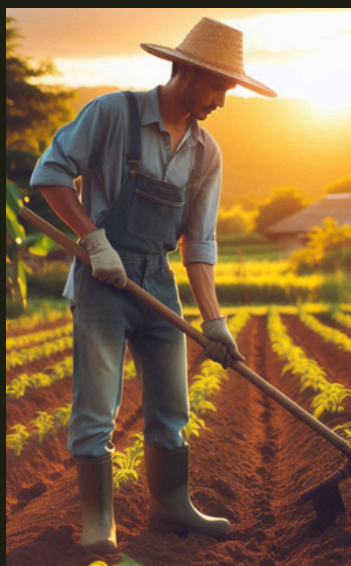
Figura 3: Trabalhador rural realizando capina.

Reforce a importância de realizar pausas frequentes para descanso e alongamento, principalmente quando a atividade for prolongada 12 .