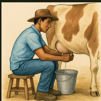
Figura 5: Trabalhador rural realizando ordenha