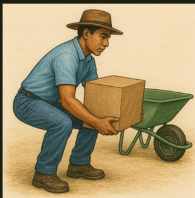
Figura 8: Trabalhador rural levantando carga.

Sempre que possível, é relevante variar a forma de levantar cargas. Incentive pausas e alternância de tarefas. Recomende o uso de carinhos de mão ou outros equipamentos de transporte, se possível. 8 9