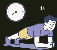
Figuras 12, 13 e 14: Exercícios de fortalecimento

Prancha: Oriente o usuário que se deite de barriga para baixo e eleve o corpo, apoiando-se nos antebraços e nas pontas dos pés, mantendo a posição por cerca de 20 a 30 segundos para fortalecer a região central do corpo.