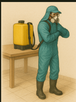
Figura 9: Paramentação para realização da pulverização manual

Para colocar o pulverizador nas costas com segurança: apoiá-lo sobre o balcão, posicionar uma das alças no ombro, girar o corpo de costas para o equipamento, e então encaixar a outra alça no ombro oposto. Isso reduz o risco de lesões na coluna e ombros 8 9 .