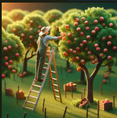
Figura 2: Trabalhador rural realizando colheita em galhos mais altos.

Como ilustrado na figura 2, oriente o trabalhador que use uma escada para colher frutos em galhos mais altos. Os membros superiores devem estar estendidos na altura do tórax. Levantar os braços em excesso pode gerar dores em ombros, punhos e cotovelos 8 9 .