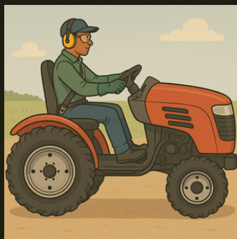
Figura 7: Representação de tratorista.

Reforce sobre o uso do cinto de segurança sempre que o trator estiver em movimento, como medida de proteção contra quedas e acidentes 8 9 .