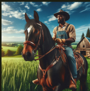
Figura 6: Trabalhador rural em montaria.

Recomende o uso de rédeas mais longas, que permitam aos braços ficarem em posição mais relaxada durante a cavalgada. Rédeas curtas devem ser utilizadas apenas quando for necessário maior controle, como em situações que exigem frenagem rápida 8 9 .