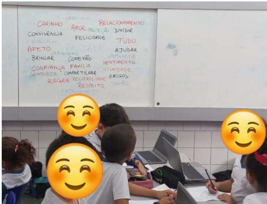
Figura 3 – Estudantes em ação, utilizando recursos tecnológicos

Momento de estimular os estudantes a investigar, refletir e produzir conhecimento sobre o tema central da Mostra, desenvolvendo autonomia, senso crítico e conexão com a própria realidade cultural.