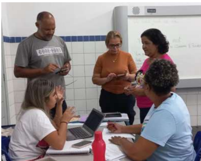
Figura 1 – Encontro com o grupo de professores para acompanhamento da construção coletiva da Mostra Cultural

Ideias de perguntas norteadoras: O que é arte e cultura para você? Como esses temas aparecem em sua prática pedagógica? Fazer registro das falas em papel pardo para posterior sistematização. Outro instrumento utilizado será o mapa mental coletivo, objetivando sistematizar ideias para os possíveis quadros e apresentações da Mostra Cultural.