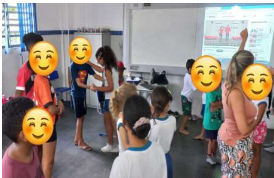
Figura 5 – Ensaio do quadro da Mostra Cultural Samba de Gafieira