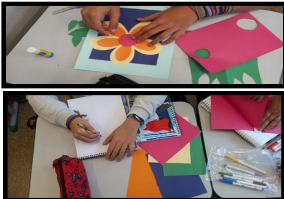
Figura 4 – Oficina “Corte e recorte”

Trata de uma proposta uma oficina para que os alunos pudessem cortar, colar criar diferentes desenhos com base na criatividade e imaginação dos alunos. A importância dessa oficina gira em torno do protagonismo e autonomia dos alunos em exercitar suas habilidades artísticas.