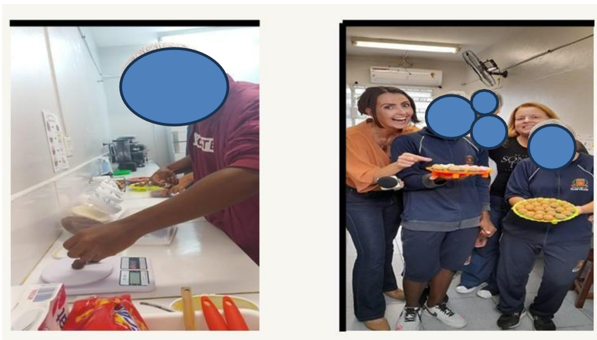
Figura 9 – Oficina Santos Docinhos