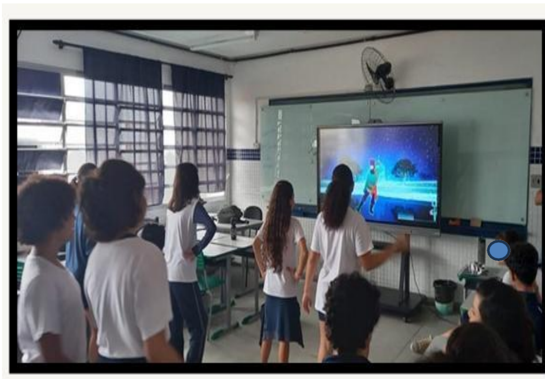
Figura 6 – Oficina de dança

respeito e compreensão dos colegas; a quebra de preconceitos a respeito da dança entre os meninos e a abertura de novos olhares sobre a dança na escola (JUSTINO, 2018).