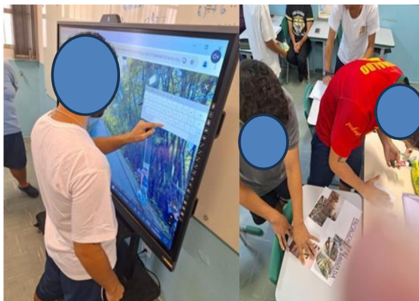
Figura 3 – Oficina “Onde Estou?”

Seus colegas e professores, da mesma forma com que os membros da comunidade escola possam conhecer as limitações e potencialidades dos alunos deficiente, As imagens (Figura 3) mostram a ocorrência das oficinas pedagógicas que irão compor este produto final em questão.