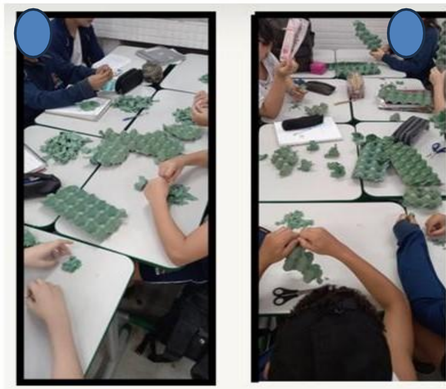
Figura 5 – Oficina de Maquete

A proposta da oficina de criação de maquetes é estimular a criatividade e imaginação dos alunos, que terão a oportunidade de utilizar materiais acessíveis e de fácil manipulação para conceber uma variedade de objetos. Optamos por utilizar as caixas de ovos provenientes do descarte da escola, após as refeições dos estudantes que consomem ovos semanalmente. Essa escolha inicial de matéria-prima foi feita de forma consciente e sustentável, visando o reaproveitamento de recursos e a redução do impacto ambiental. Na elaboração das maquetes, foi sugerido aos alunos a possibilidade de trabalharem de forma individual ou em grupos, com a liberdade de recortar, colar e pintar suas criações.