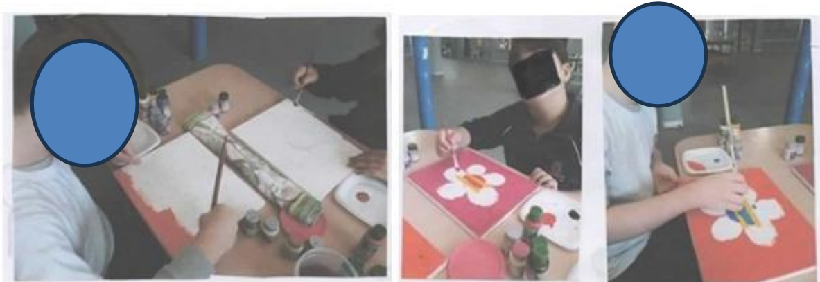
Figura 8 - Oficina de pintura de Romero Brito.