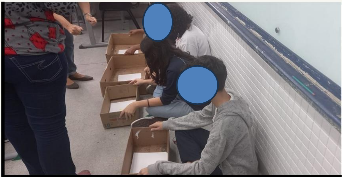
Figura 7 – Oficina de pintura abstrata