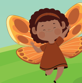
Ilustração por Bárbara C D Prado