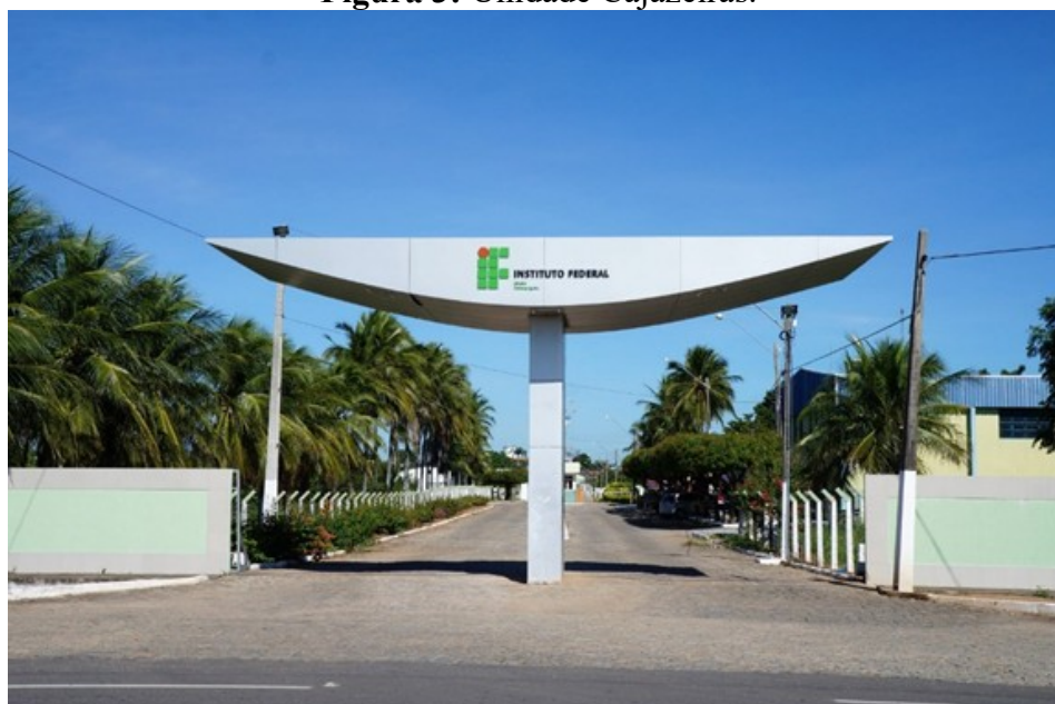
Figura 3: Unidade Cajazeiras.