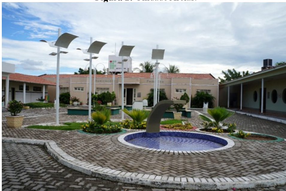
Figura 2: Unidade Areias.