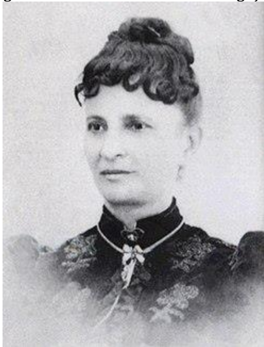
Figura 6 – Nísia Floresta.

Enquanto Nísia Floresta empenhava-se para ser reconhecida como escritora e educadora, as lutas políticas agitavam o Legislativo brasileiro, local de grande divergência de ideias políticas. A tarefa de construir instituições para o Estado independente, em substituição ao antigo governo português ocupava a atenção dos homens públicos. Embora uns defendessem a adoção da forma de governo republicano, a maior parte deles preferia manter a monarquia, apesar do crescente número de pessoas insatisfeitas com o governo de D. Pedro I. Por fim, em abril de 1831, Dom Pedro I abdicou do trono do Brasil, retornou a Portugal e deixou aqui seu filho, uma criança de 5 anos. (MARQUES, 2019, p. 21-23)