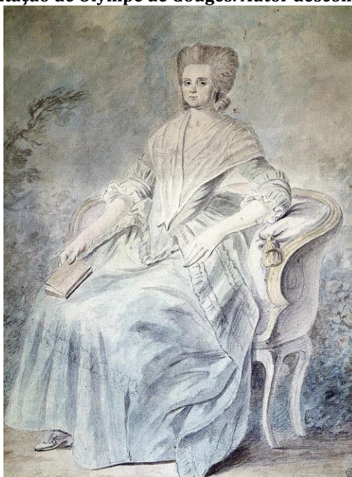
Figura 1 - Representação de Olympe de Gouges. Autor desconhecido. Século XVIII.

Em 1793, durante o Terror, Olympe de Gouges ataca Robespierre e os Montanheses, acusando-os de querer instaurar uma ditadura e censurando-os pelas violências cegas. Após a insurreição parisiense de 31 de maio, 1º e 2 de junho e a queda da Gironda, ela toma partido abertamente em favor desta na Convenção. Presa em 20 de julho de 1793 por ter redigido um cartaz federalista de caráter girondino, As Três Urnas ou a Salvação da Pátria, ela será julgada em 2 de novembro e executada no cadafalso no dia seguinte. (DENÖEL, 2023) (tradução nossa)