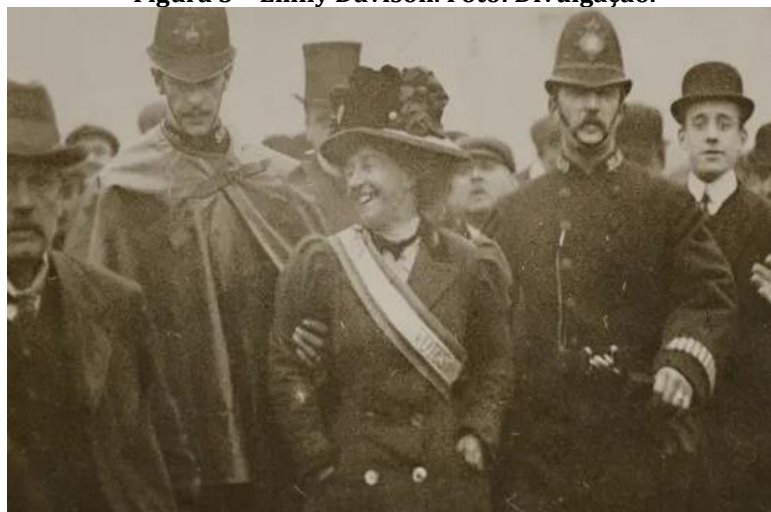
Figura 3 – Emily Davison.

Celi Regina Jardim Pinto (2010) aponta que as sufragetes promoveram grandes manifestações em Londres, foram presas várias vezes, fizeram greves de fome. Traz ainda a informação de que, em 1913, na famosa corrida de cavalo em Derby, a feminista Emily Davison (figura 3) atirou-se à frente do cavalo do Rei, morrendo.