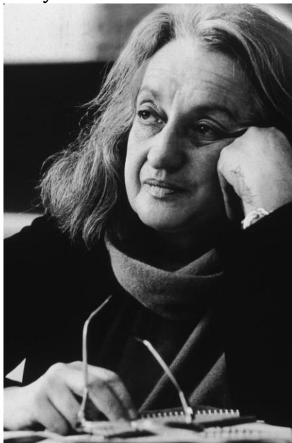
Figura 5 – Betty Friedan em 1980.