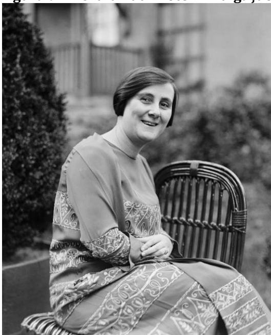
Figura 9 – Bertha Lutz.