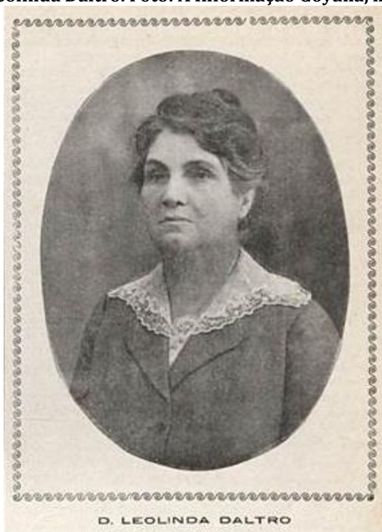
Figura 8 – Leolinda Daltro. Foto: A Informação Goyana, maio de 1921.