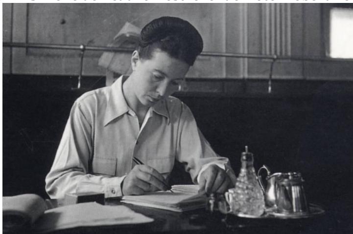
Figura 4 – Simone de Beauvoir escrevendo.