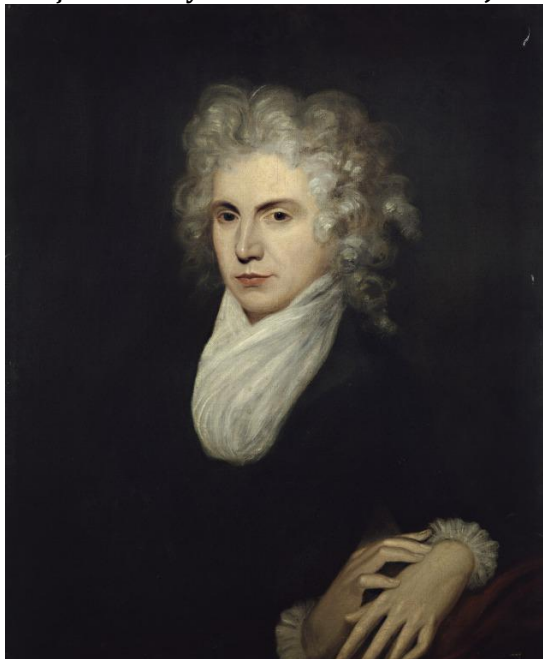
Figura 2 – Representação de Mary Wollstonecraft. Autor: John Williamson, 1797.

Wollstonecraft (figura 2) contesta que existam diferenças naturais no caráter ou na inteligência de meninos e meninas. As autoras pontuam que a inferioridade da mulher, segundo ela, adviria unicamente de sua educação; portanto, que se ofereça às meninas idênticas oportunidades de formação intelectual e desenvolvimento físico que as existentes para os meninos.