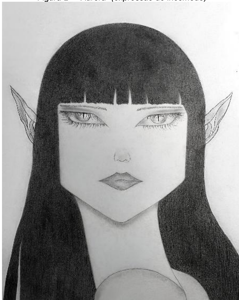
Figura 2 – “Aurora” (expressão de incômodo)

estado de bem-estar e satisfação. O próprio título reforça uma atmosfera de leveza e serenidade, evocando associações simbólicas com o céu e a tranquilidade. No contexto pedagógico, essa imagem configura-se como um ponto de partida acessível para as crianças, favorecendo o reconhecimento de emoções positivas e a construção de vínculos com experiências cotidianas. Sua análise contribui para o desenvolvimento da empatia e da comunicação.