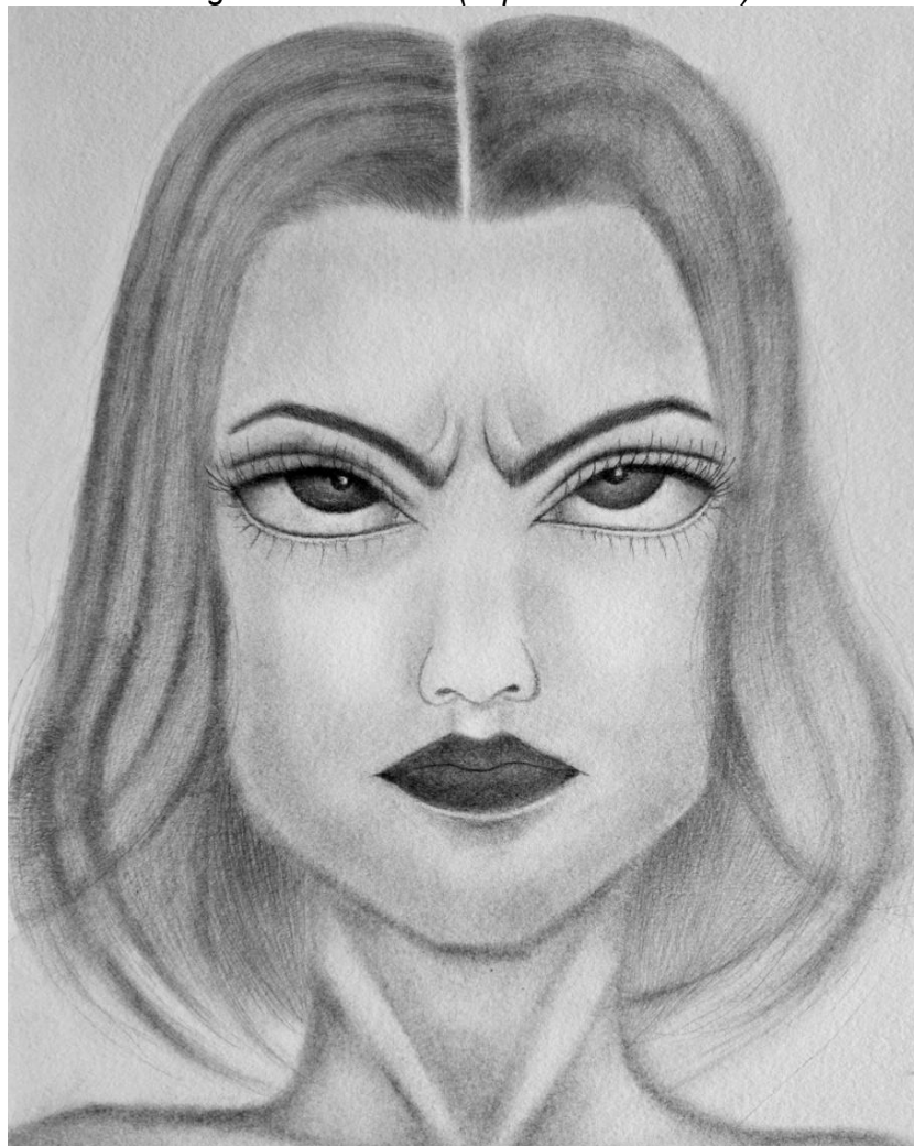
Figura 3 – “Vênus” (expressão de raiva)