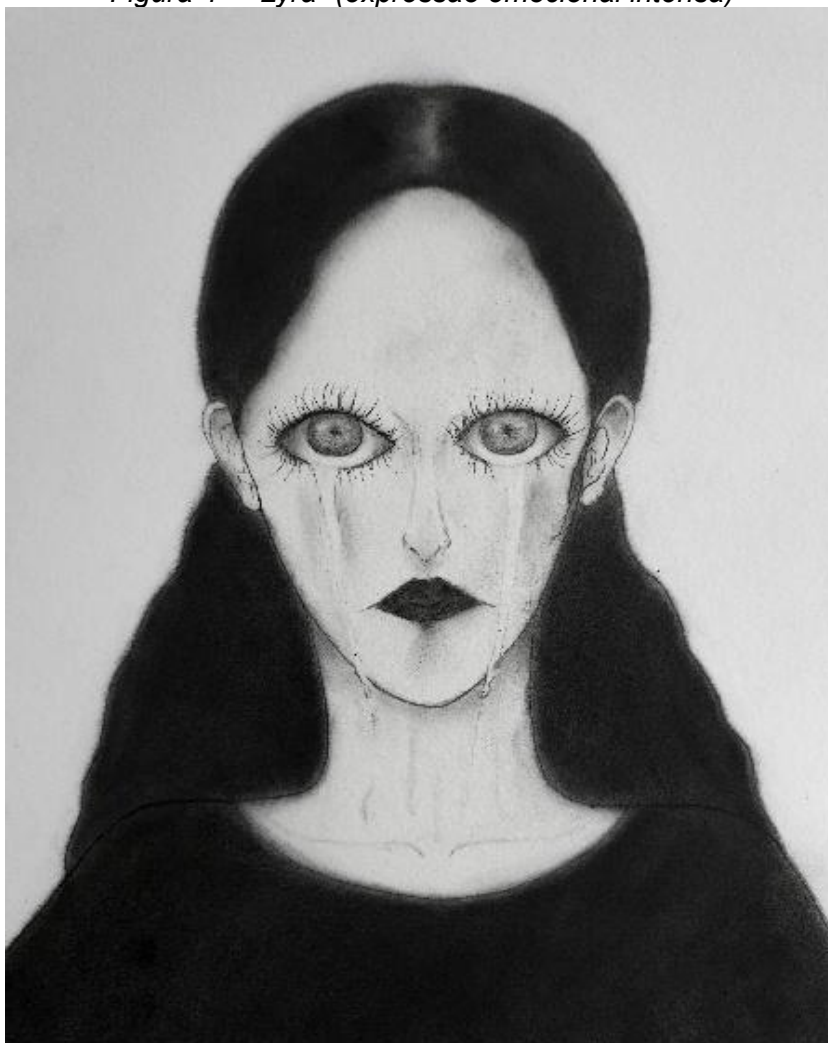
Figura 4 – “Lyra” (expressão emocional intensa)