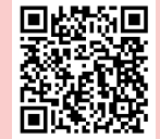
Amamentação: como fazer a pega, posições corretas e dicas essenciais

Aponte a câmera do celular para o QR Code e assista a vídeos sobre posições para amamentar, pega correta e dicas práticas para o dia a dia.