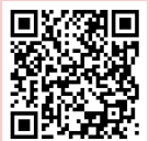
Dicas sobre a amamentação