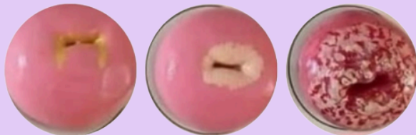
Colo do útero inflamado