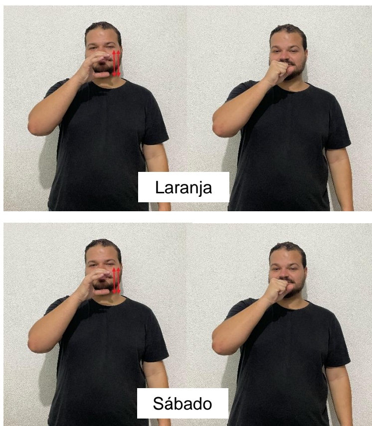
Figura 02 – Sinais de laranja e sábado