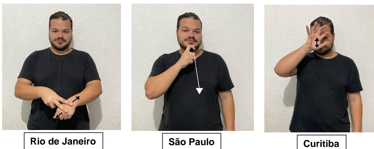
Figura 9 – Sinal da cor verde

Por exemplo, um sinal utilizado no Rio de Janeiro pode ser diferente do sinal utilizado em São Paulo para representar a mesma palavra ou conceito. Essas variações enriquecem a língua e refletem a diversidade cultural das comunidades surdas no Brasil. A regionalização dos sinais pode ser comparada aos diferentes sotaques e dialetos encontrados em uma língua falada, que refletem a identidade cultural e regional das comunidades.