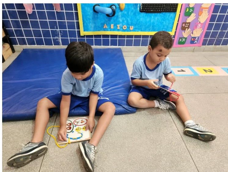
Figura 11 – Trabalhando coordenação psicomotor e à autonomia

Atuei como Professor – Tradutor Interpretador de Libras por 3 anos na Educação Infantil de uma escola municipal localizada em São João de Meriti – RJ, lá trabalhava diretamente com crianças surdas, mais especificamente, duas crianças. A partir dessas experiências, trago algumas narrativas autobiográficas e reflexões a partir dos aspectos teóricos trazidos anteriormente.