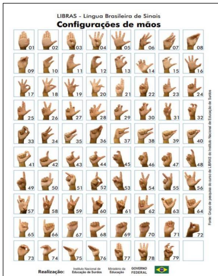
Figura 01 – Configurações de mão