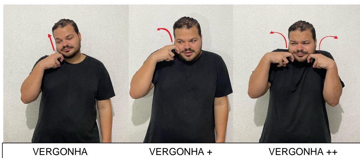
Figura 6 – Intensidade do grau de vergonha

A expressão facial e corporal é um dos cinco parâmetros fundamentais da Língua Brasileira de Sinais (Libras). Refere-se ao uso de expressões faciais, movimentos dos olhos, sobrancelhas, boca e até mesmo a postura corporal que acompanham os sinais manuais. As expressões não são apenas acessórios aos sinais, mas partes integradas que fornecem contexto emocional, intensidade e nuances de significado. Sem a expressão correta, os sinais podem se tornar ambíguos ou perder parte do seu significado. O objetivo das expressões é enriquecer a mensagem, garantindo uma comunicação mais completa e eficaz, transmitindo sentimentos e atitudes de forma mais precisa.