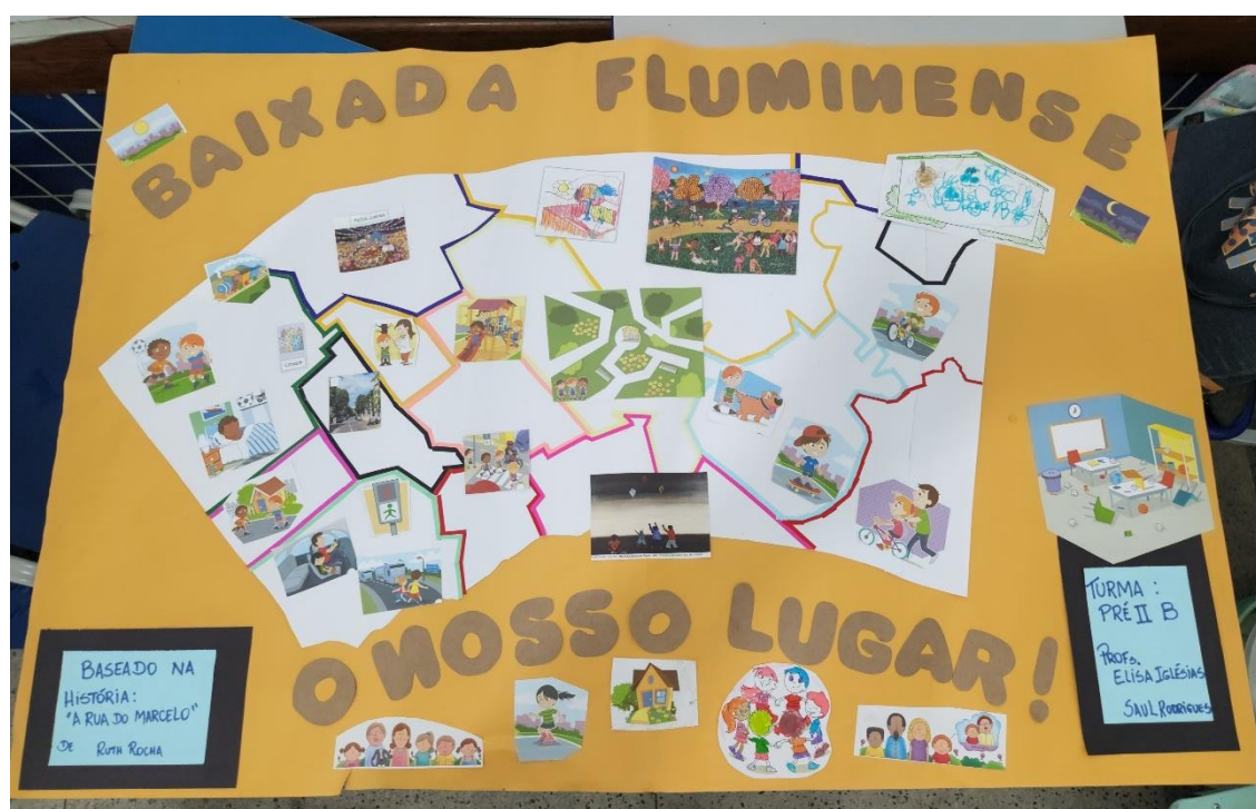
Figura 17 – Cartaz do dia da Baixada Fluminense

O professor está inclinado, acompanhando de perto e orientando. A atenção do educador está totalmente voltada à mediação da atividade, garantindo que a criança compreenda e execute a tarefa corretamente. Objetivos Pedagógicos dessa atividade é: Alfabetização digital - familiarização com o uso do computador, mouse e teclado e Autonomia e letramento tecnológico - incentivo ao uso da tecnologia como ferramenta de aprendizagem. Essa experiência contribui para o desenvolvimento da autonomia, da concentração e da familiaridade com recursos digitais desde os primeiros anos escolares.