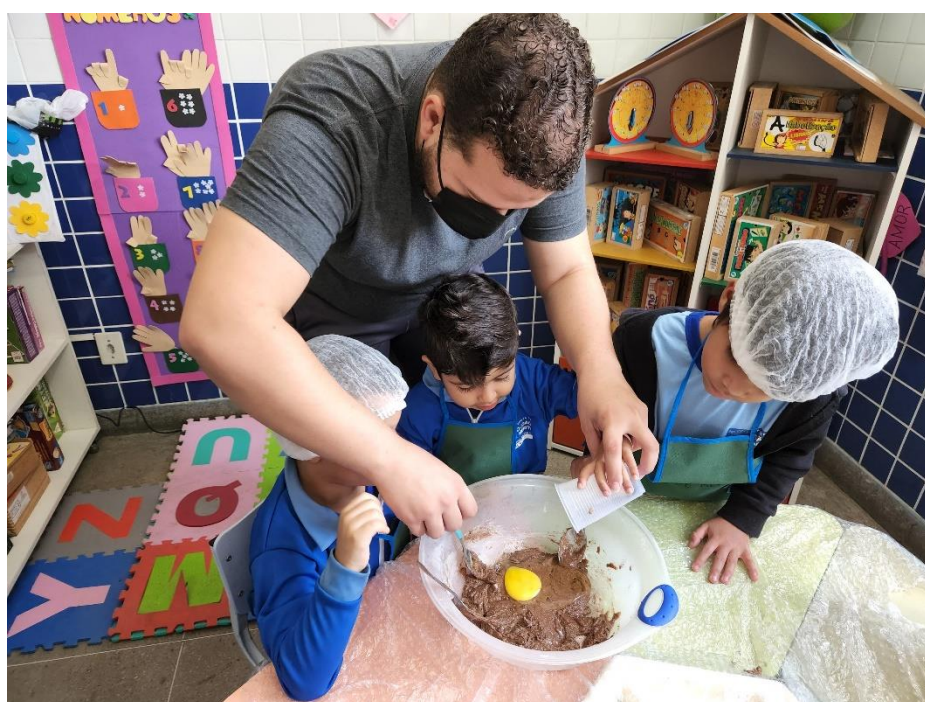
Figura 13 – Trabalhando receita e medidas

Na segunda imagem, a criança está colorindo figuras das frutas que está aprendendo em Libras em um cartão de atividades com quadrinhos ilustrados enquanto o adulto a orienta, apontando com os dedos diretamente na folha. A atividade envolve associação de imagens com objetos reais, um vocabulário visual-sensorial - Alfabetização visual tátil; reconhecimento e nomeação de frutas fazendo a estimulação da linguagem usando materiais simples como: giz de cera, tesoura sem ponta, cola e frutas reais (manga, laranja, mamão).