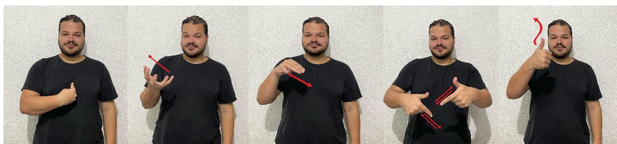
Figura 7 – Ordem da frase

Na Gramática da Libras possui uma gramática própria, que difere da gramática do português. A estrutura das frases em Libras é determinada pela ordem dos sinais e pelo uso de expressões faciais, que desempenham um papel crucial na transmissão de significado. Diferente do português, a Libras é uma língua visual-espacial, onde a localização dos sinais no espaço e os movimentos das mãos e do corpo são fundamentais para a comunicação. Segundo Quadros e Karnopp (2007), a Língua de Sinais Brasileira tem estrutura diferente da Língua Portuguesa, ou seja, as relações sujeito-verbo-objeto são diferentes.