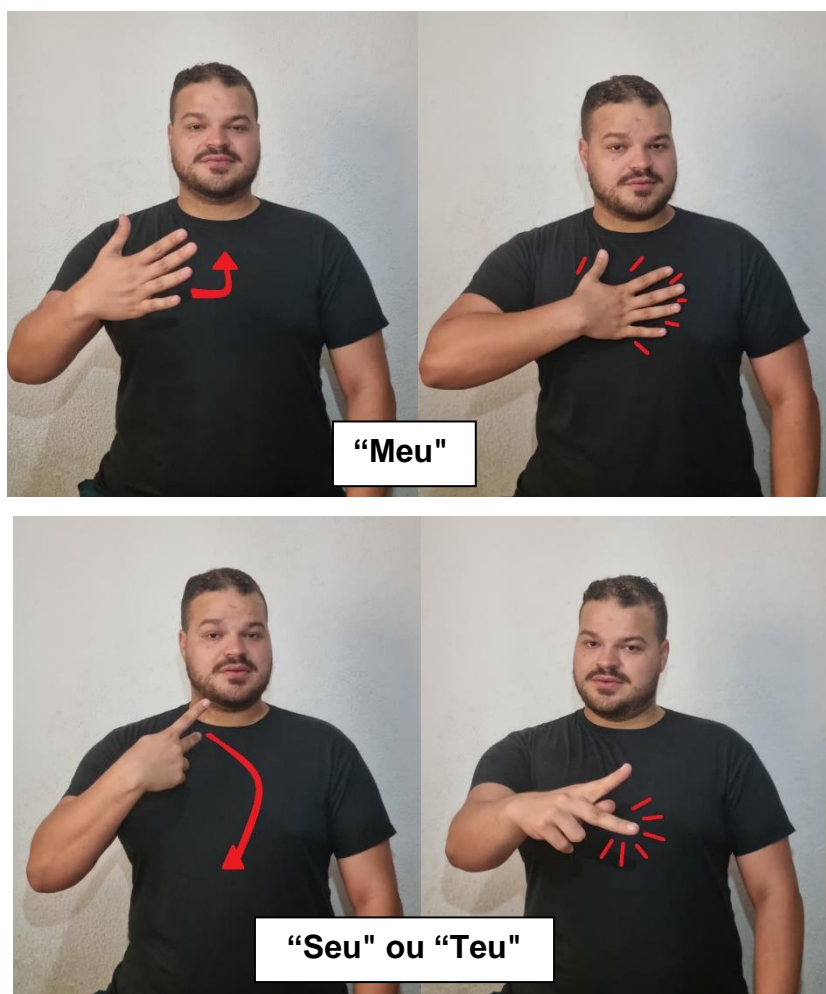
Figura 3 – Sinais “Meu” e “Seu” e/ou “Teu” em Libras