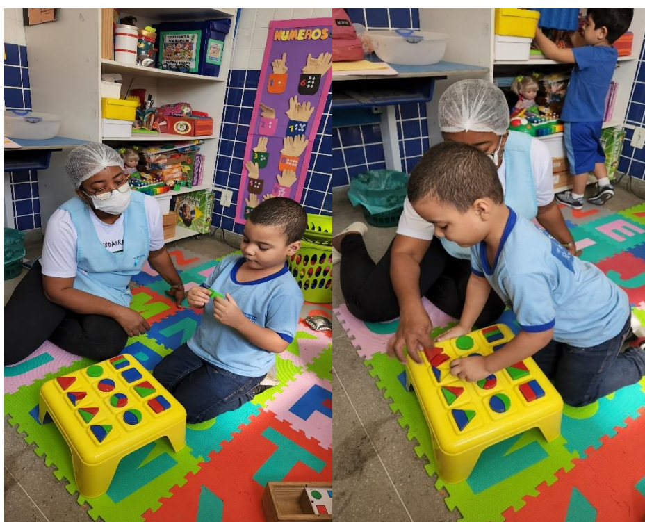
Figura 15 - Trabalhando na sala de recursos

Essa atividade envolve múltiplas competências: Alfabetização visual; Associação entre letras e sinais (Libras); Coordenação motora fina (uso dos pregadores); Aprendizado bilíngue e inclusão de crianças surdas aprendendo Libras; Trabalho com identidade e território, ao explorar a palavra “Baixada” — que faz referência à Baixada Fluminense, promovendo vínculo cultural com a comunidade local.