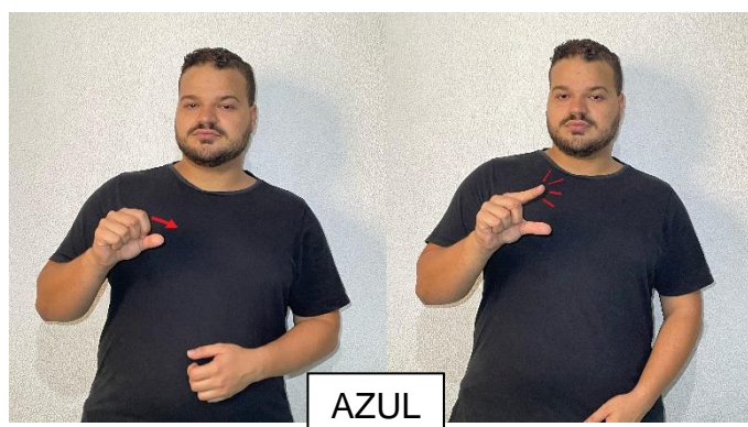
Figura 5 – Diferença dos tipos de azul de acordo com a movimentação das mãos

variações no movimento podem alterar completamente o significado de um sinal. Além disso, a movimentação pode transmitir nuances de intensidade, duração e emocionalidade, acrescentando riqueza à comunicação em Libras.