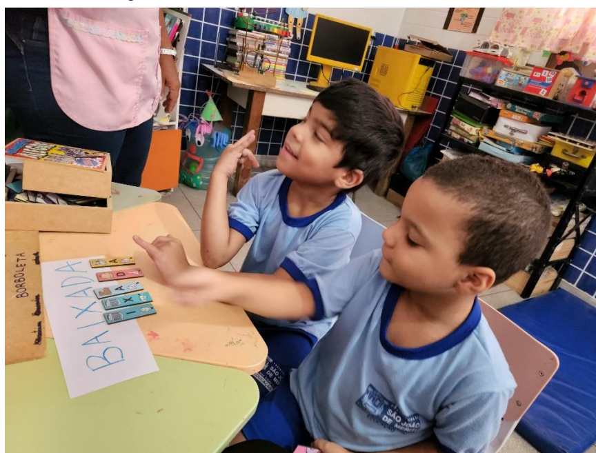
Figura 14 - Trabalhando na sala de recursos

Essa atividade de culinária educativa, tem vários objetivos integrados como: Desenvolvimento da coordenação motora fina e ampla (mexer, misturar, despejar); Trabalho com noções de quantidade, sequência e tempo (importante para alfabetização matemática); Incentivo ao trabalho em equipe e responsabilidade; Vivência prática de higiene e segurança alimentar. Além disso, a presença de recursos em Libras e de materiais acessíveis torna esta proposta pedagógica inclusiva.