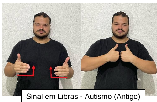
Figura 10 – Autismo

Outro aspecto importante da Libras na contemporaneidade é a sua interação com a tecnologia. Ferramentas tecnológicas e plataformas digitais estão cada vez mais sendo utilizadas para ensinar e difundir a Libras. Aplicativos móveis, vídeos educativos e redes sociais são recursos valiosos para o aprendizado e a prática da língua de sinais. Essas tecnologias também facilitam a comunicação entre surdos e ouvintes, promovendo maior inclusão e acessibilidade.