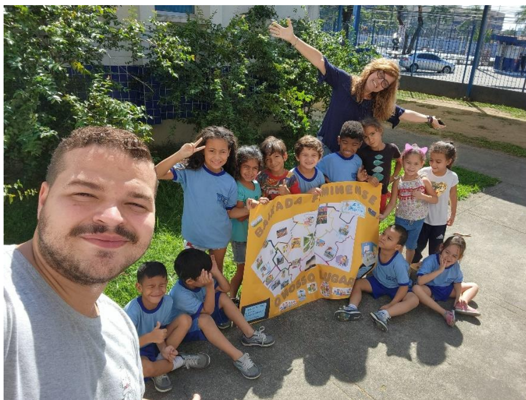
Figura 18 – Exposição do cartaz