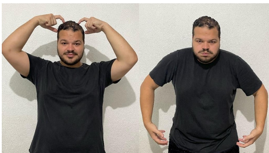
Figura 8 – Classificador de Urso Grande

Além disso, a Libras possui elementos gramaticais próprios, como classificadores, que são sinais que representam categorias de objetos, pessoas ou formas. Esses classificadores são usados para descrever o tamanho, a forma, o movimento e a localização dos objetos no espaço. A utilização dos classificadores é um aspecto único e complexo da Libras, que acrescenta uma camada adicional de nuance e detalhe à comunicação.