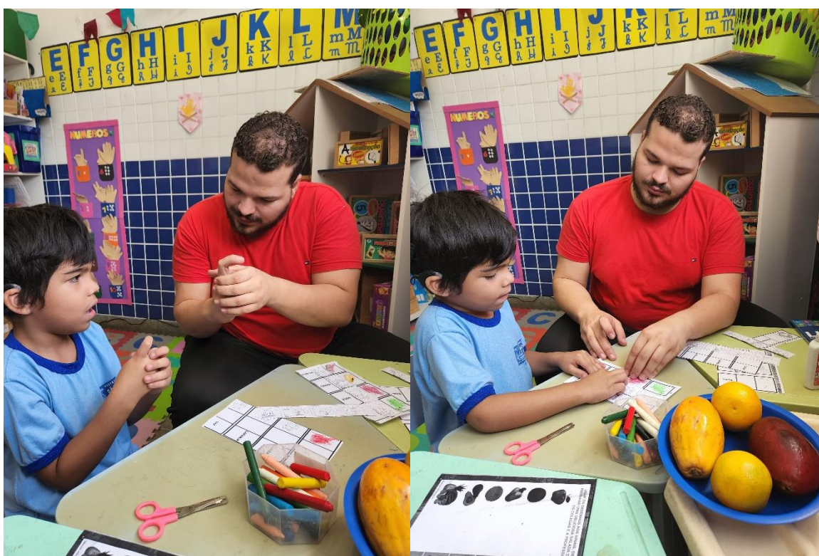
Figura 12 – Trabalhando conceitos de frutas e cores

A atividade envolve segura uma prancha educativa de madeira com figuras coloridas. Com uma das mãos, eles passam um cadarço pelos furos no tabuleiro, fazendo o movimento de laçadas ou costuras — atividade comum para desenvolver das habilidades de coordenação motora fina e concentração. Importante observamos também o ambiente, pois ele colabora para a eficácia e dinâmica da proposta, ambiente tranquilo e sem distração.