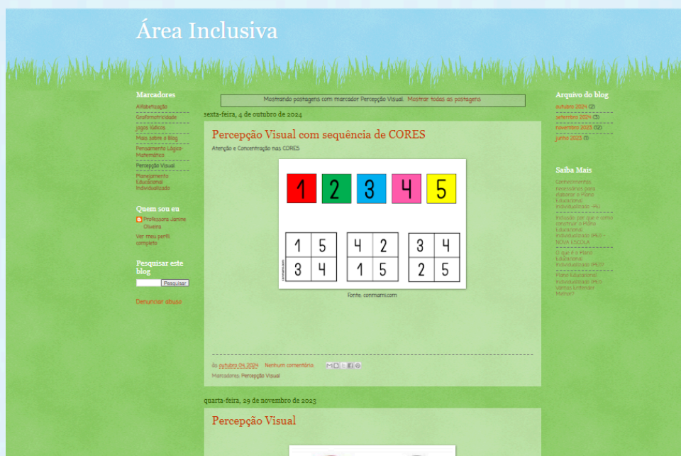
Visual" Figura 7 – Resultado da pesquisa no blog Área Inclusiva utilizando o marcador "Percepção