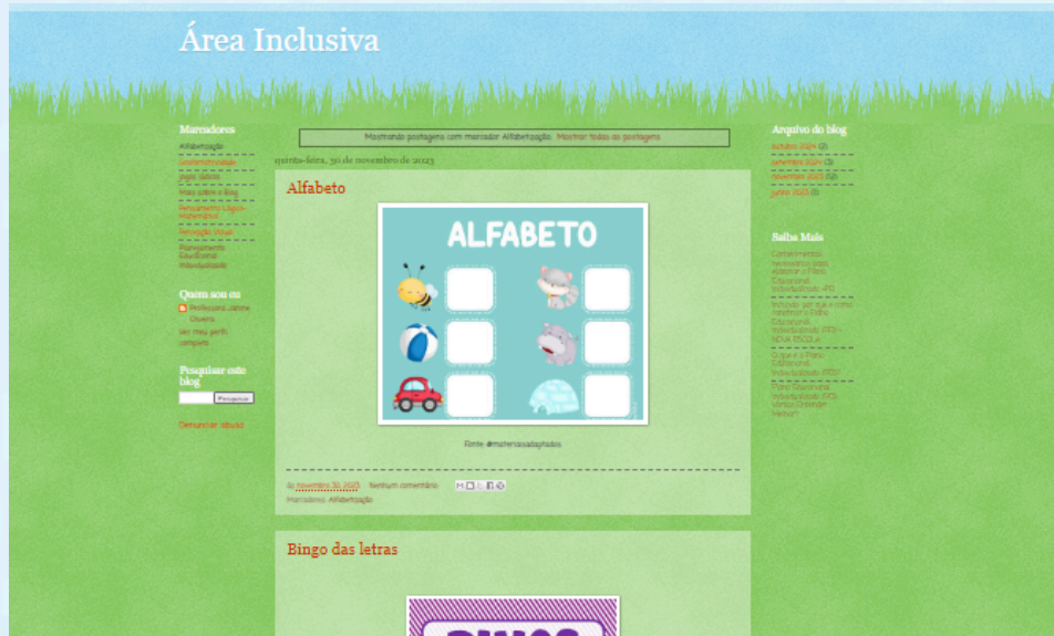
Figura 3 – Resultado da pesquisa no blog Área Inclusiva utilizando o marcador "Alfabetização"