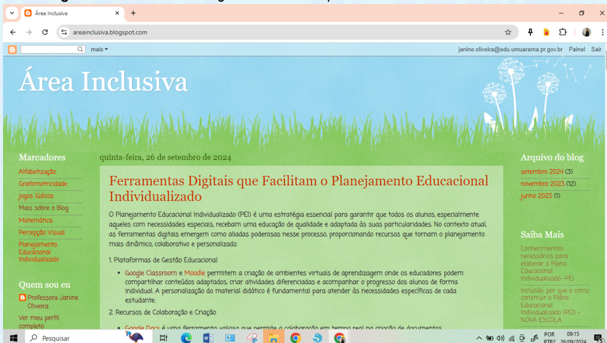
Figura 4 – Tela inicial do blog vista de um computador