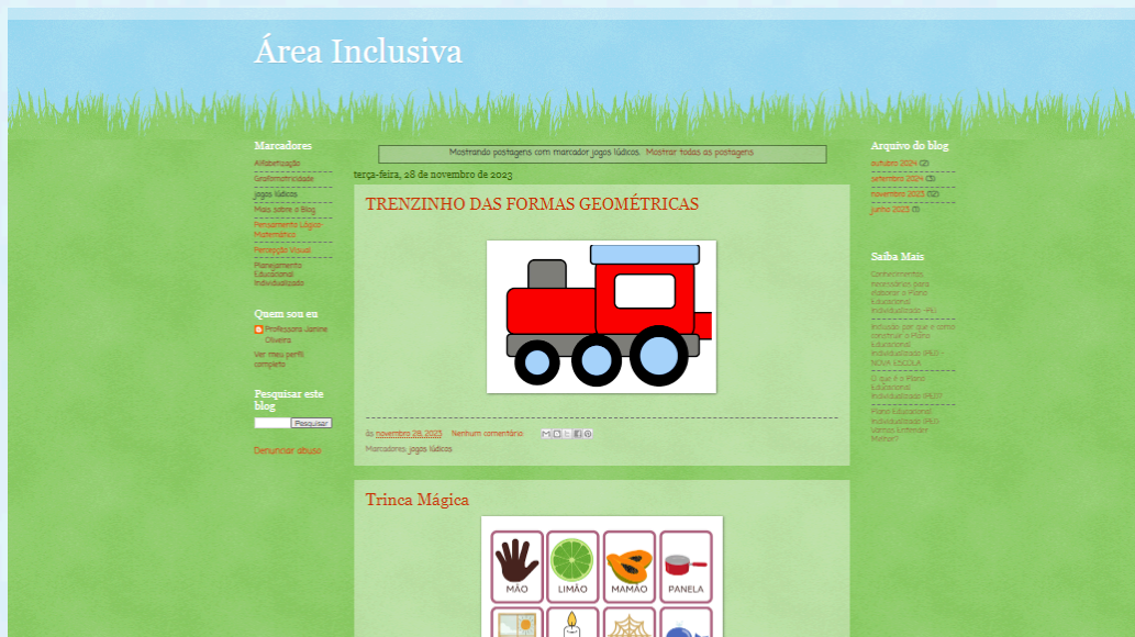
Figura 5 – Resultado da pesquisa no blog Área Inclusiva utilizando o marcador "Jogos Lúdicos"