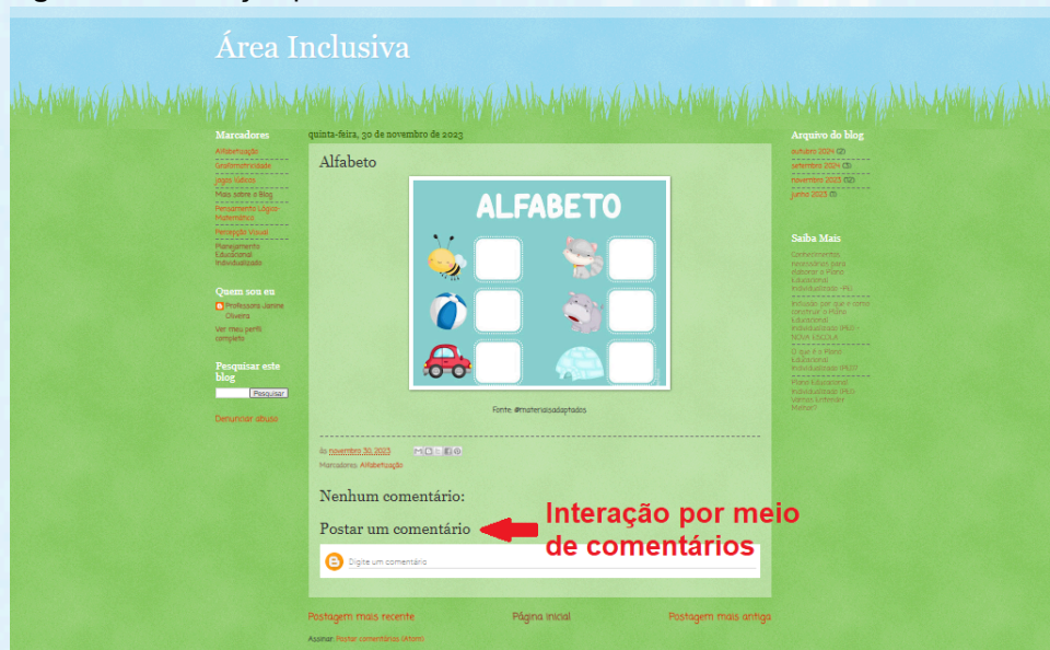
Figura 2 – Indicação para comentários