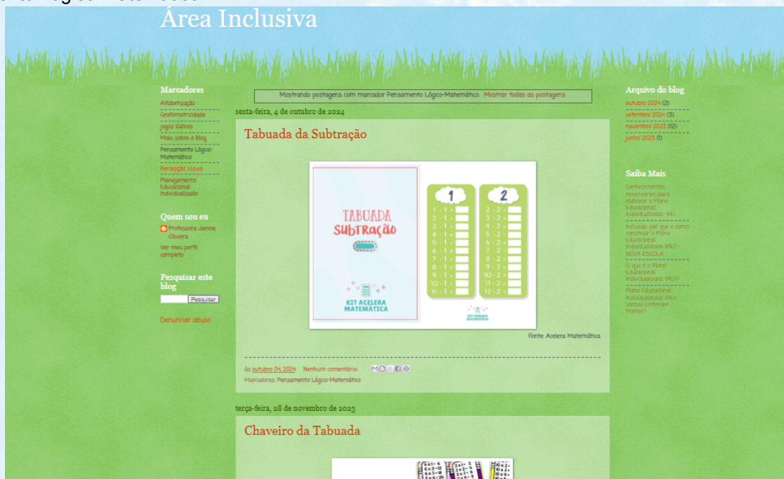
Figura 6 – Resultado da pesquisa no blog Área Inclusiva utilizando o marcador "Pensamento Lógico-Matemático"