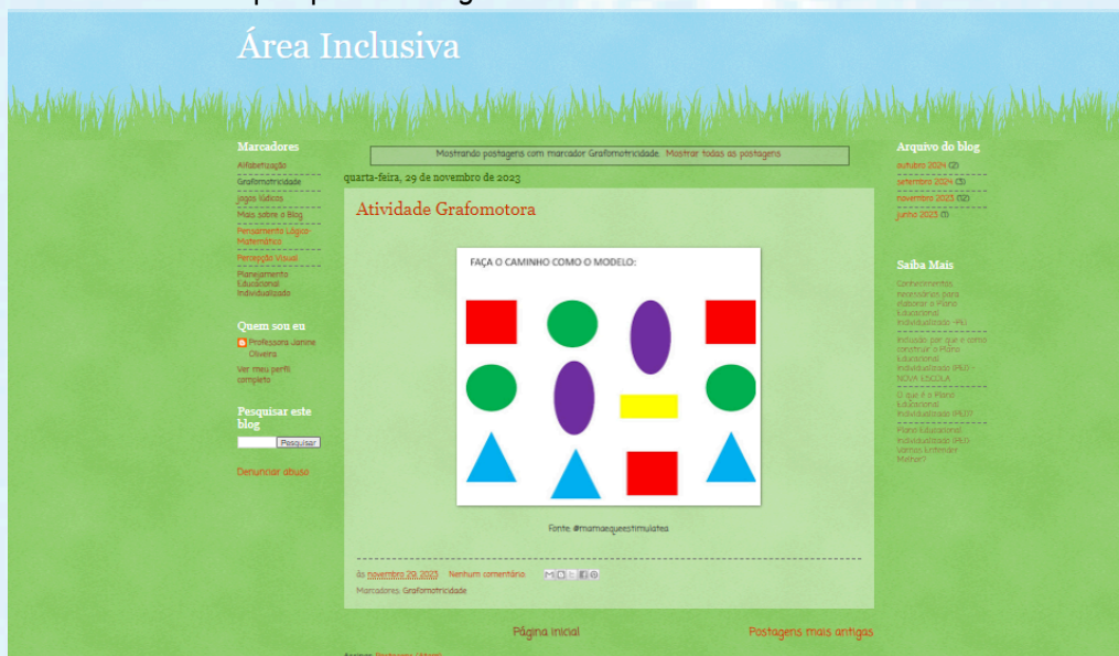
Figura 4 – Resultado da pesquisa no blog Área Inclusiva utilizando o marcador "Grafomotricidade"