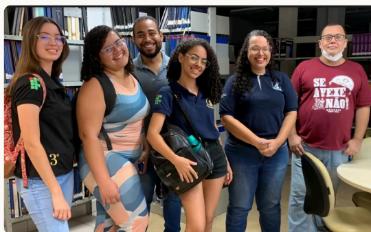
- Núcleo Maceió