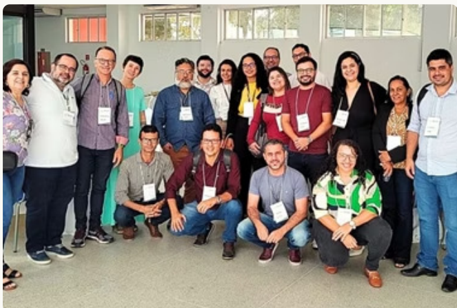
-Lançamento da IFAL ECOSOL em julho/2023