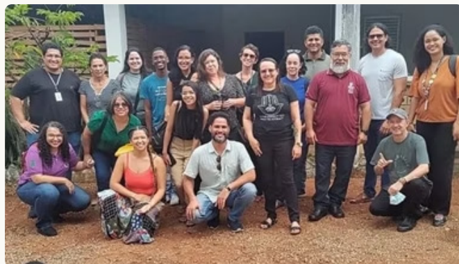
- Intercâmbio com a ITES UFAL-Arapiraca