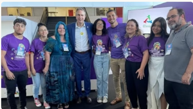
-Projetos da IFAL ECOSOL na SENPET