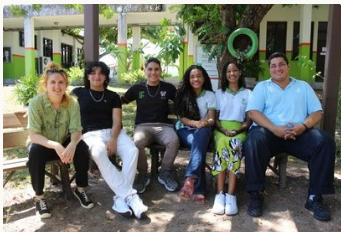
-Núcleo Marechal Deodoro