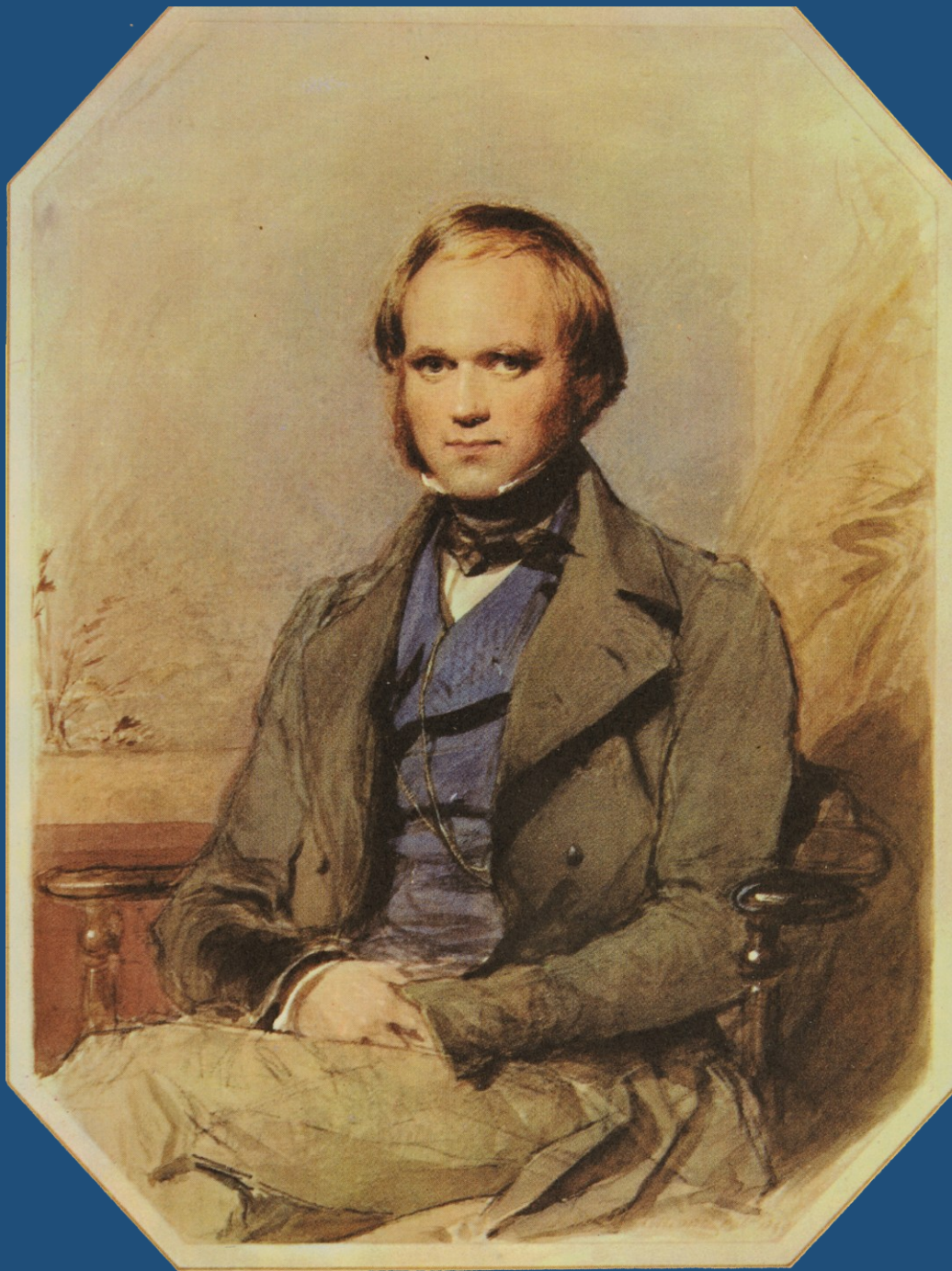
Charles Darwin, 1840, por George Richmond.