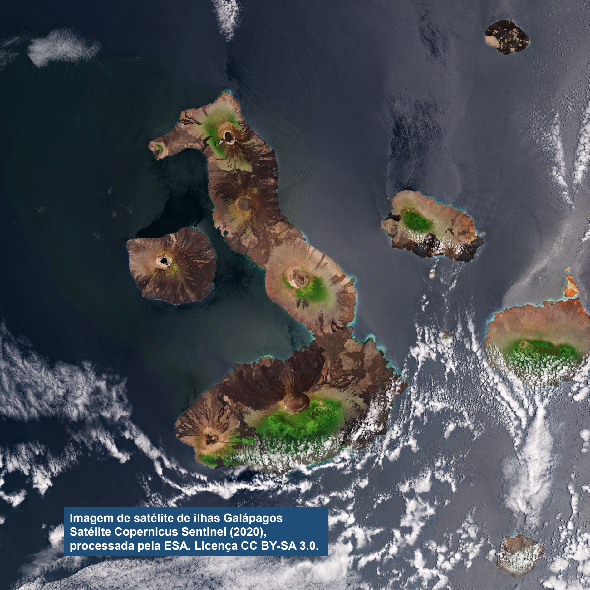
Imagem de satélite de ilhas Galápagos