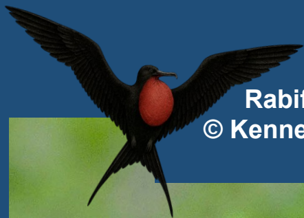
Rabiforcado-Magnífico ( Fregata magnificens ) © Kenneth Lorenzen. Santa Cruz, Ecuador, 2011. Acervo iNaturalist . Licença CC-BY-4.0.