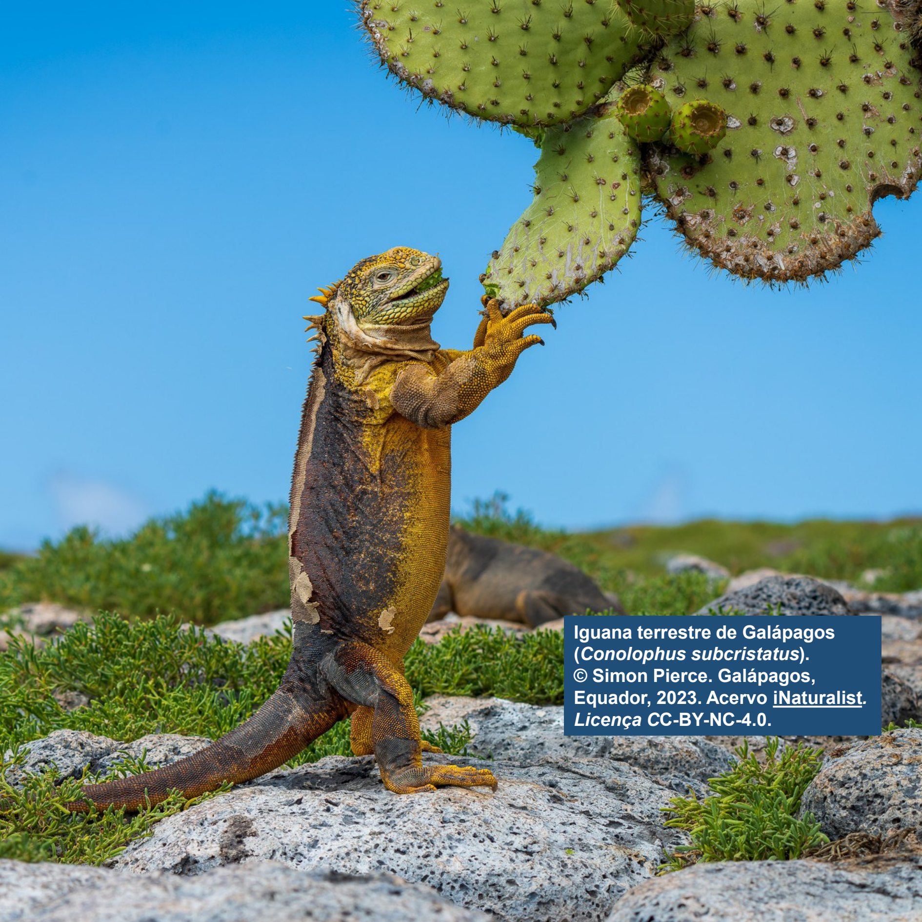
Iguana terrestre de Galápagos ( Conolophus subcristatus ). Galápagos, Ecuador, 2023.