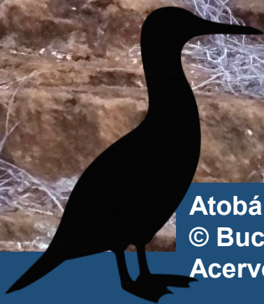
Atobá de Pés Azuis ( Sula nebouxii ssp. excisa ). © Buckwheat Bastard. San Cristóbal, Equador, 2024. Acervo iNaturalist . Licença CC-BY-NC-4.0.