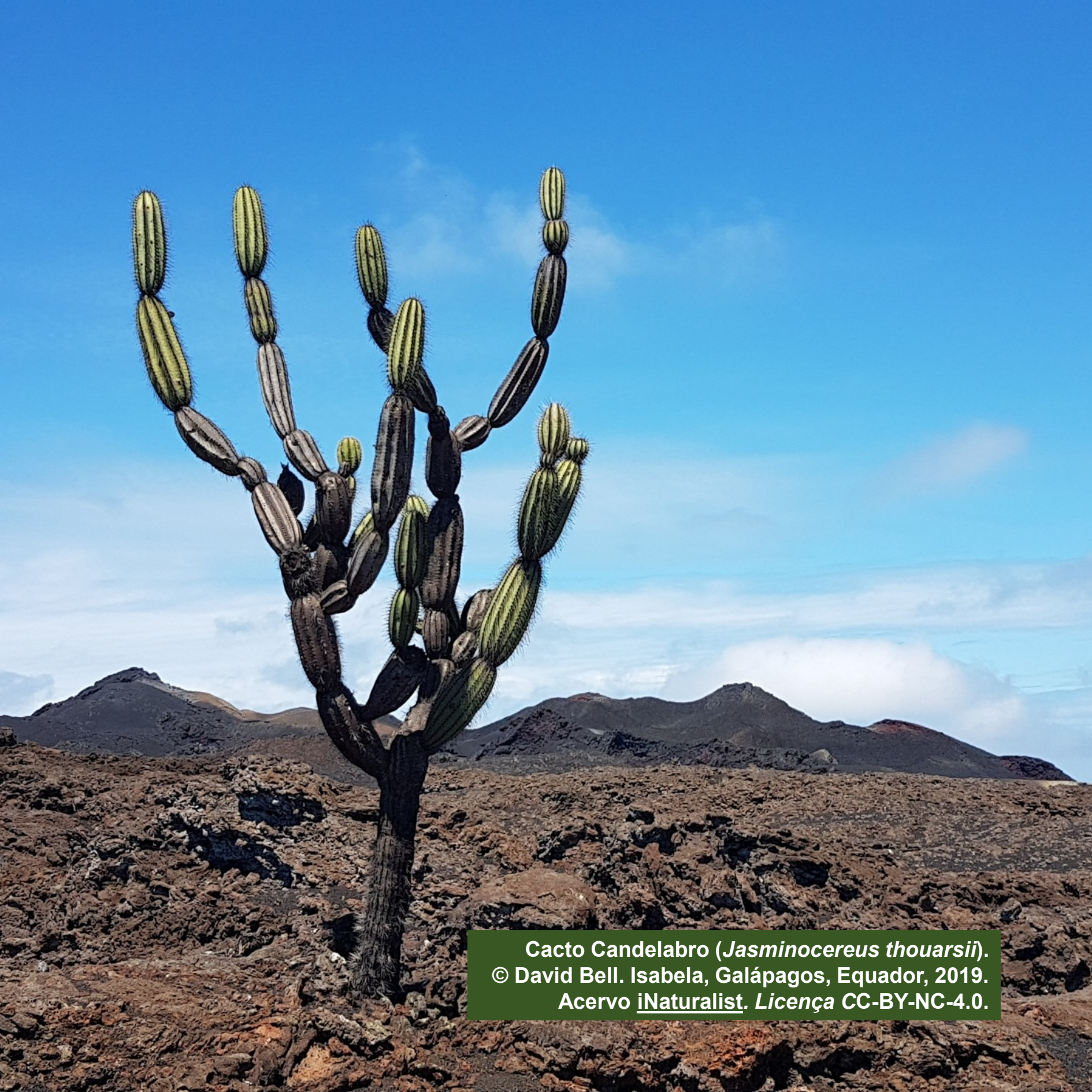
Cacto Candelabro ( Jasminocereus thouarsii ). © David Bell. Isabela, Galápagos, Equador, 2019. Acervo iNaturalist . Licença CC-BY-NC-4.0.