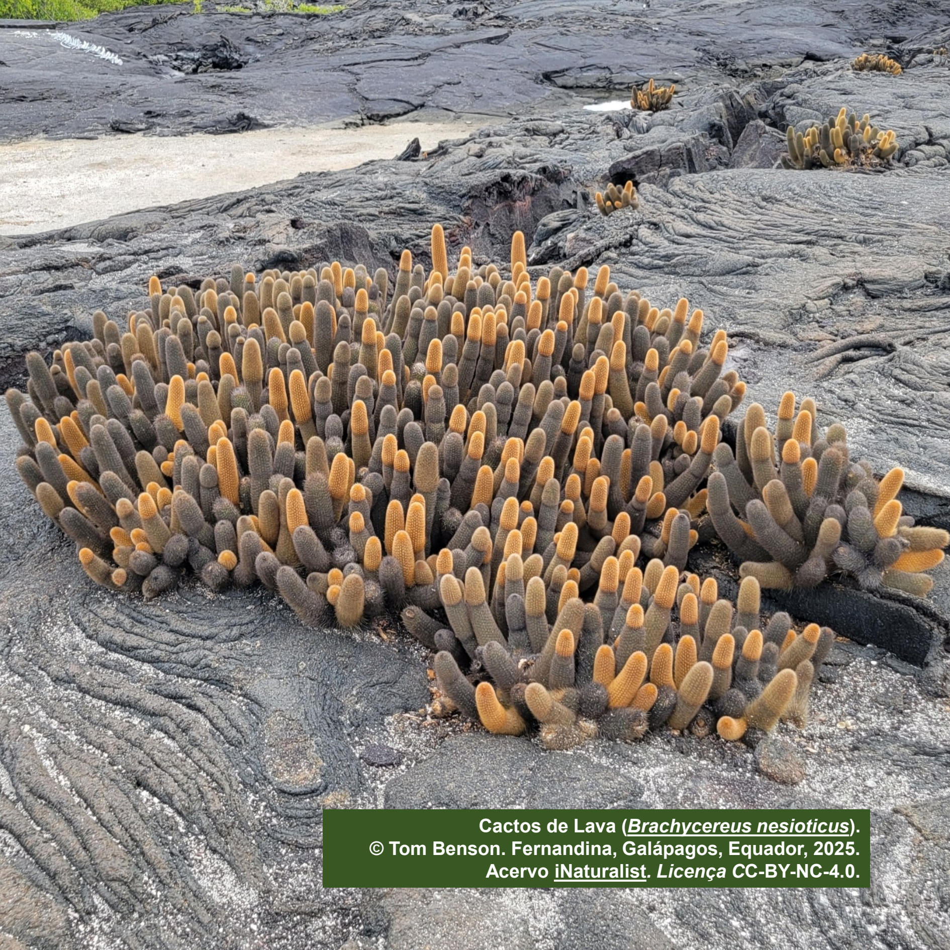
Cactos de Lava ( Brachycereus nesioticus ). © Tom Benson. Fernandina, Galápagos, Ecuador, 2025. Acervo iNaturalist . Licença CC-BY-NC-4.0.