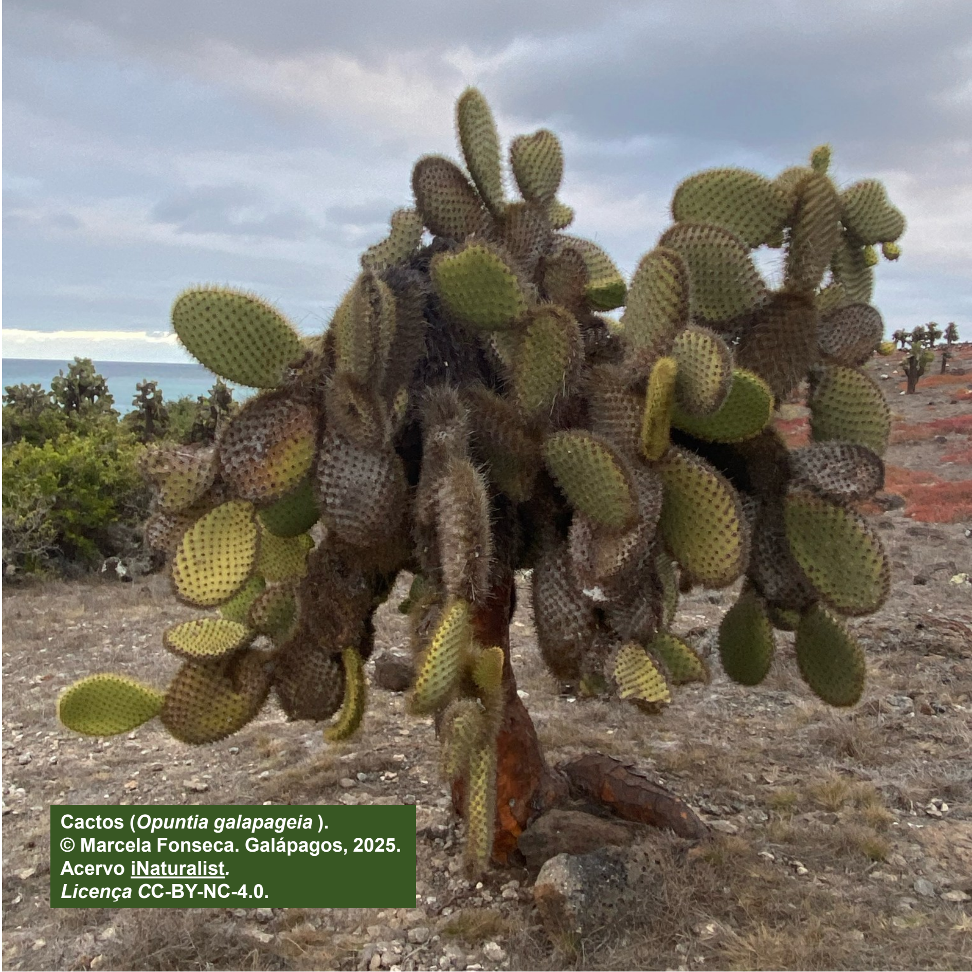
Cactus ( Opuntia galapageia ). © Marcela Fonseca. Galápagos, 2025. Acervo iNaturalist . Licença CC-BY-NC-4.0 .