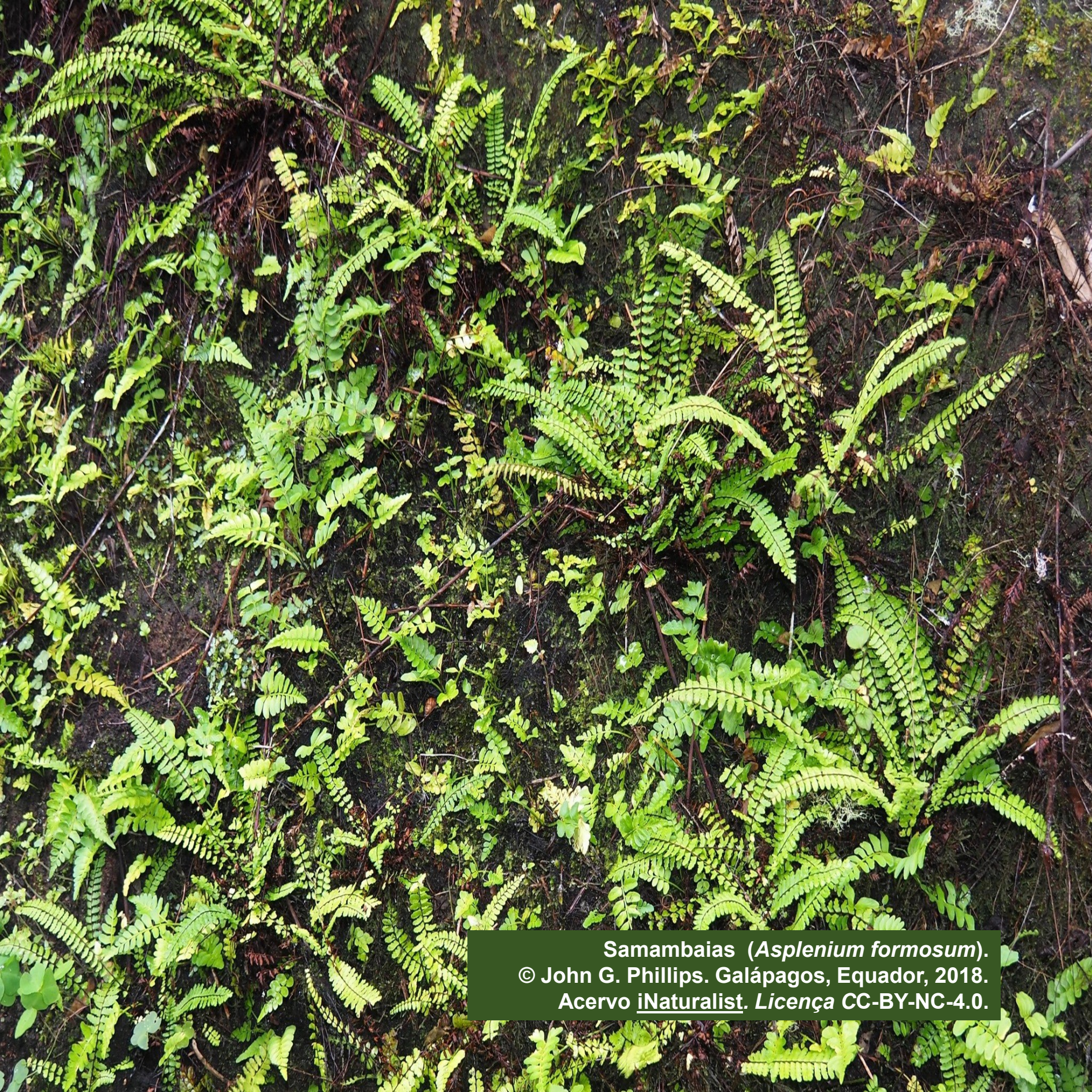
Samambaias ( Asplenium formosum ). © John G. Phillips. Galápagos, Ecuador, 2018. Acervo iNaturalist . Licença CC-BY-NC-4.0.