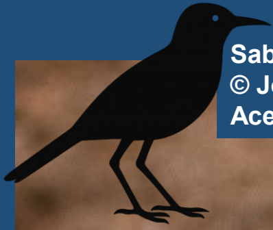
Sabiá de Floreana ( Mimus trifasciatus ). © John and Nancy Crosby. Ecuador, 2010. Acervo iNaturalist . Licença CC-BY-NC-4.0.