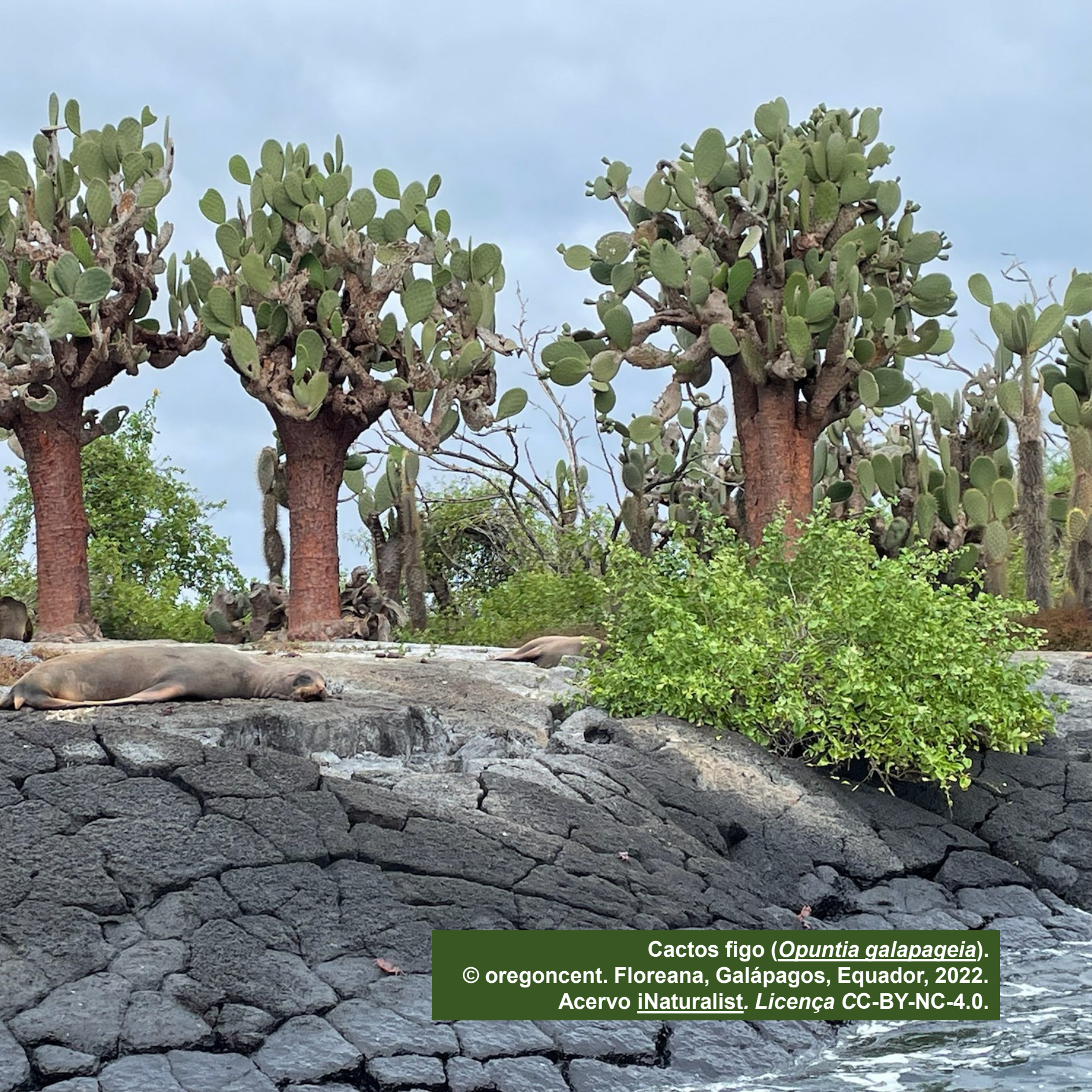
Cactus figo ( Opuntia galapageia ). © oregoncent. Floreana, Galápagos, Equador, 2022. Acervo iNaturalist . Licença CC-BY-NC-4.0.