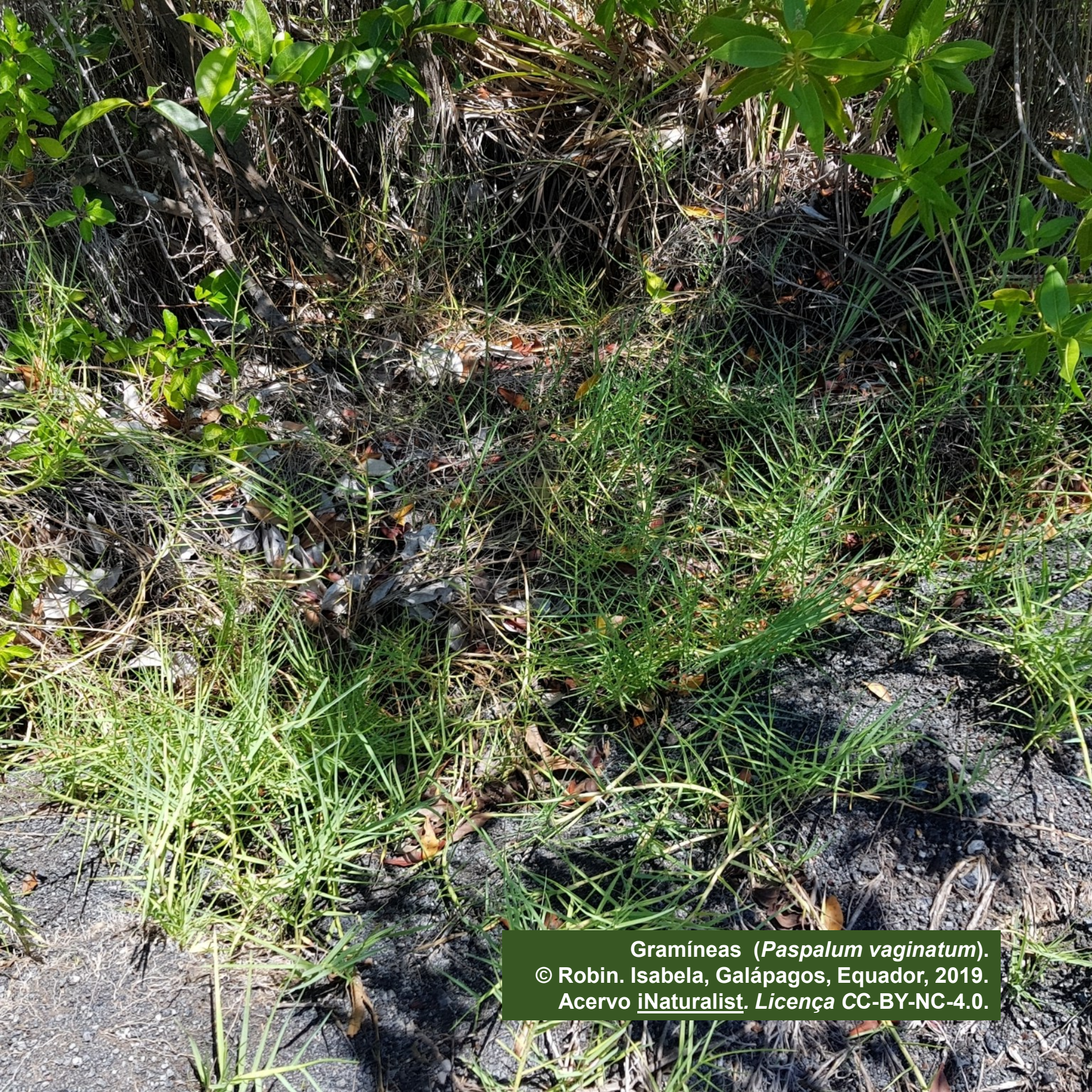
Gramíneas ( Paspalum vaginatum ). © Robin. Isabela, Galápagos, Equador, 2019. Acervo iNaturalist . Licença CC-BY-NC-4.0.