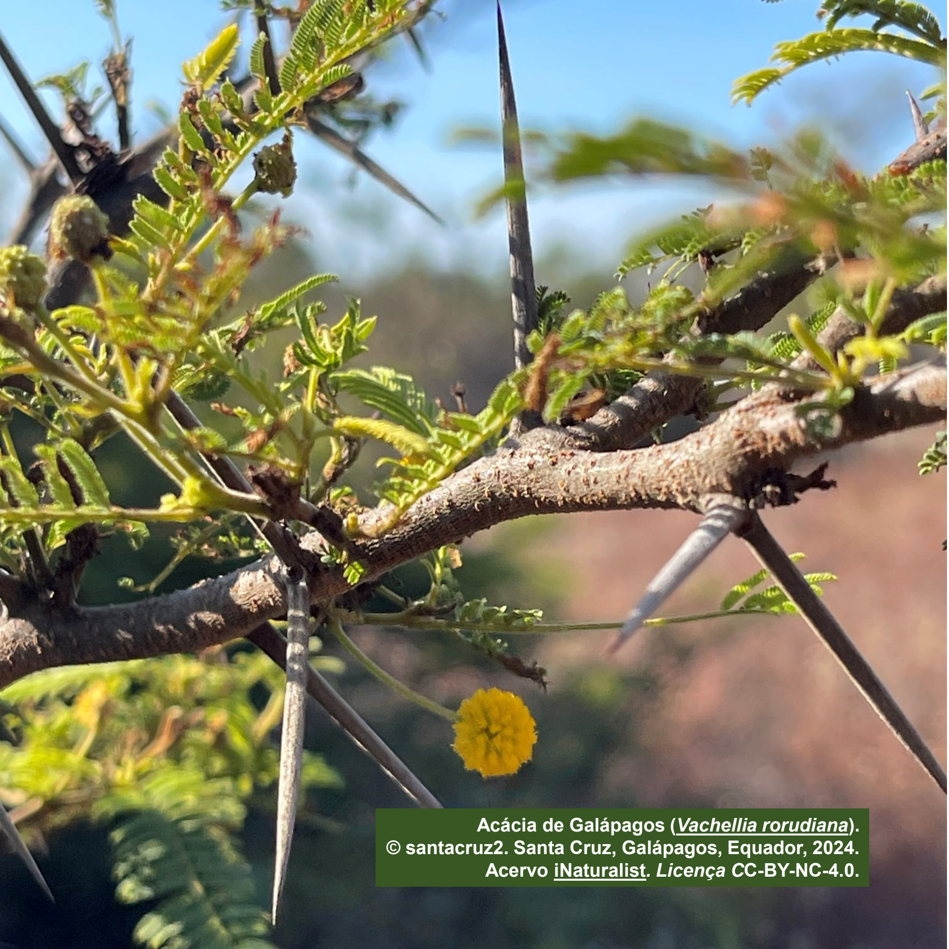
Acácia de Galápagos ( Vachellia rorudiana ). © santacruz2. Santa Cruz, Galápagos, Equador, 2024. Acervo iNaturalist . Licença CC-BY-NC-4.0.