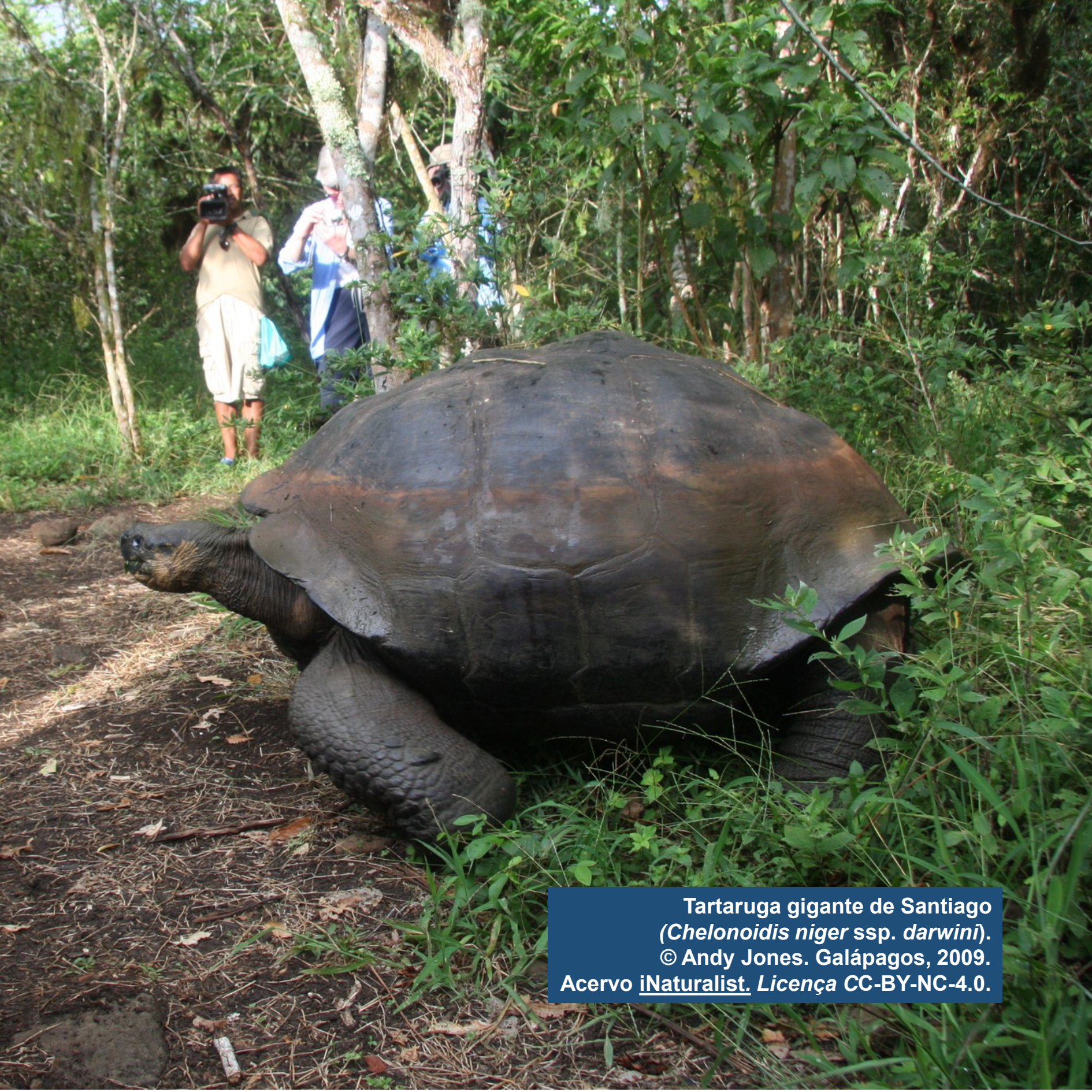
Tartaruga gigante de Santiago ( Chelonoidis niger ssp. darwini ). © Andy Jones. Galápagos, 2009. Acervo iNaturalist . Licença CC-BY-NC-4.0.