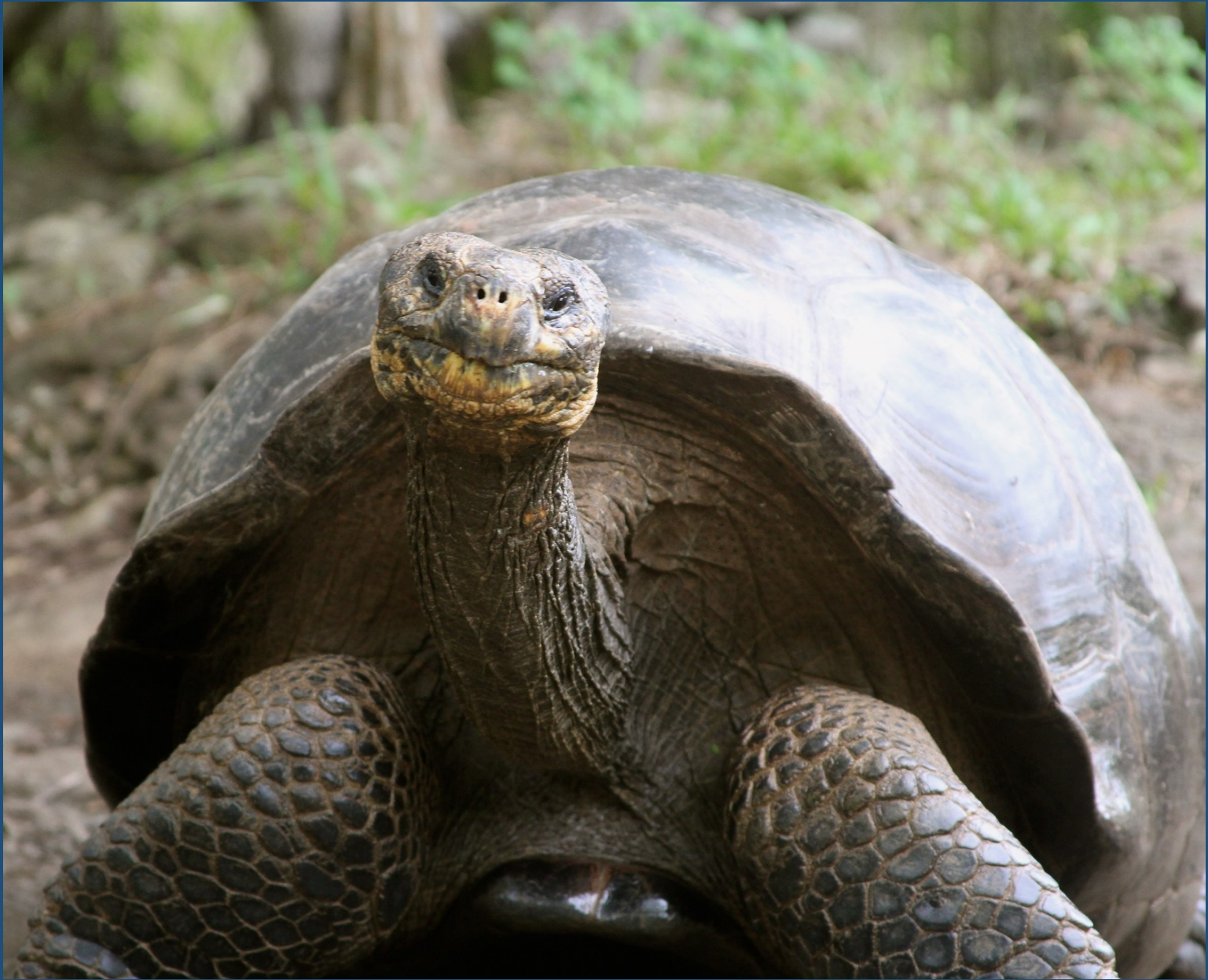
Tartaruga gigante de São Cristóvão ( Chelonoidis niger ssp. chathamensis ). © Jenn Megyesi. São Cristóvão, Galápagos, Equador, 2015. Acervo iNaturalist . Licença CC-BY-NC-4.0.