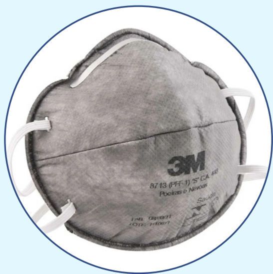
Máscara carvão ativado