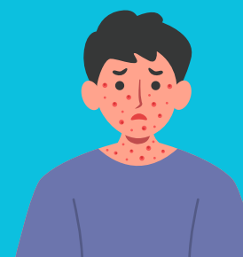
MANCHAS NO CORPO