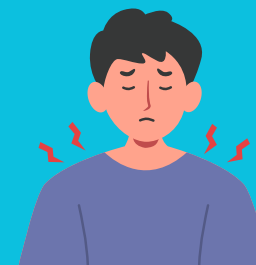
DORES NO CORPO