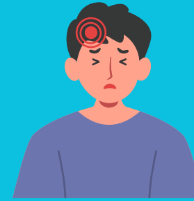
FORTES DORES DE CABEÇA