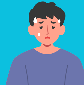
FRAQUEZA E CANSAÇO