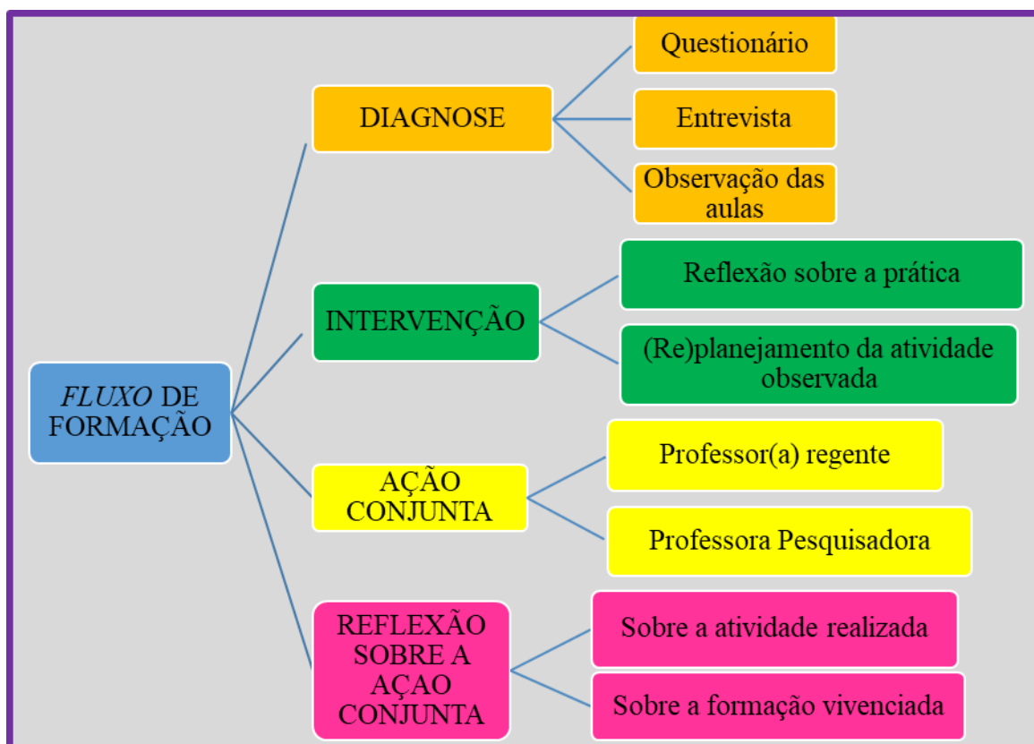
Fluxograma 1: Formação realizada com os professores que ensinam Matemática nos anos iniciais do Ensino Fundamental em escolas do Campo.

O fluxograma abaixo, apresenta as etapas da formação desenvolvida em serviço.